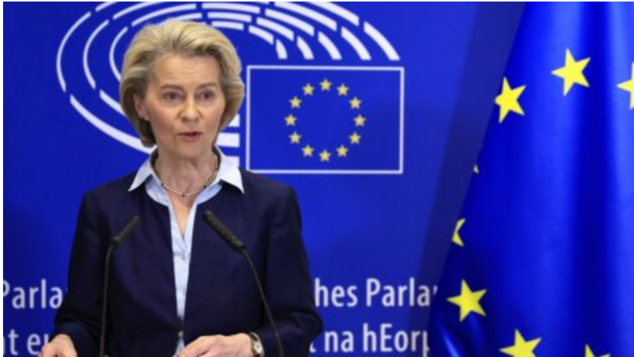
Vlna žalob na předsedkyni Evropské komise von der Leyenovou