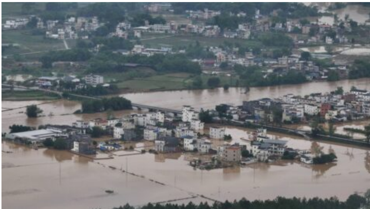
Jihočínská provincie Kuang-tung se po silném dešti připravuje na stoleté povodně