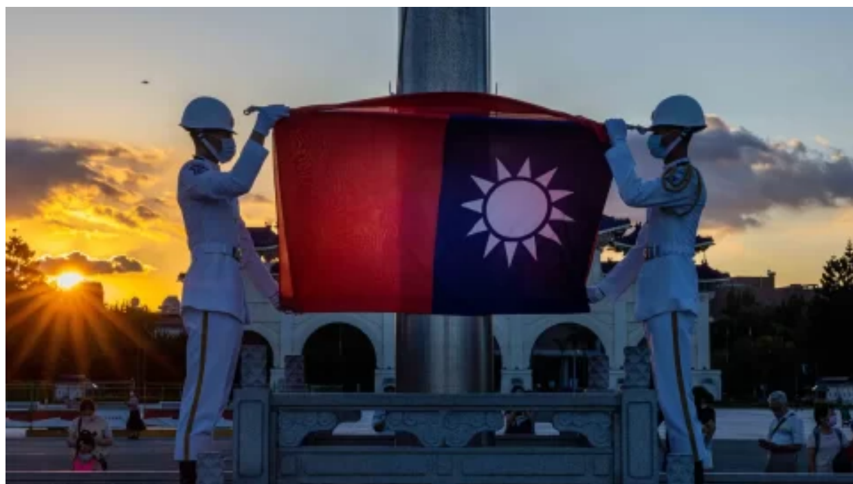
Zákon o miliardové vojenské pomoci Tchaj-wanu prošel Sněmovnou reprezentantů USA