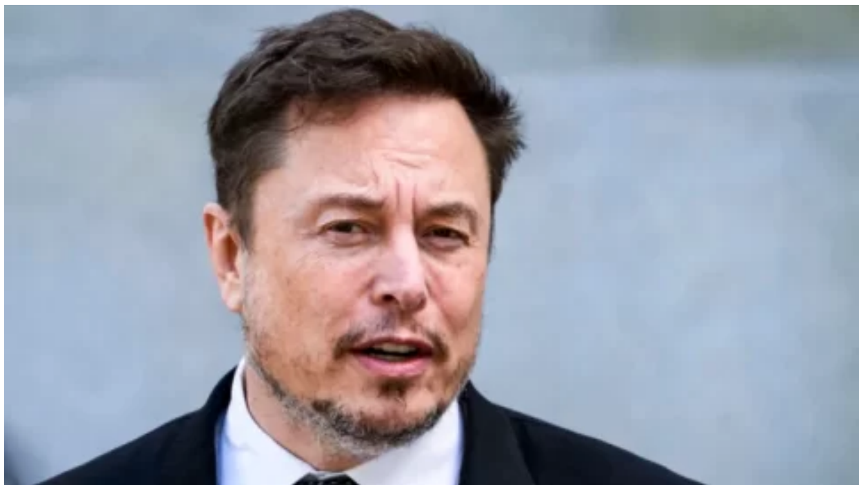
Musk k procesu s Trumpem: „Tento případ poškozuje právo“