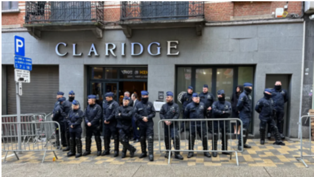
Svoboda slova v Bruselu