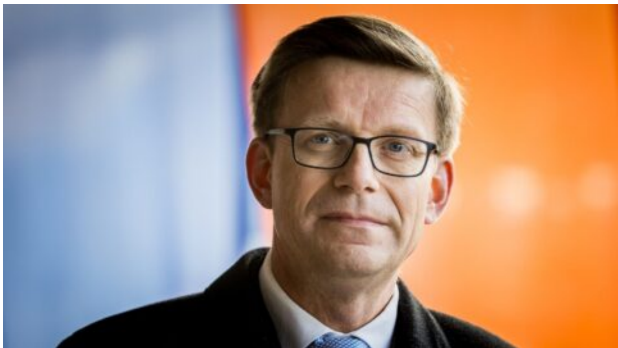
Dotace na elektromobily nejsou třeba, na trhu se prosadí samy, myslí si ministr Kupka