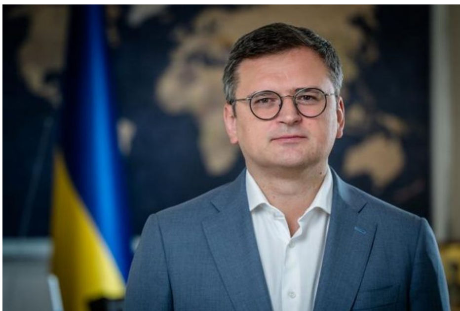
Dmytro Kuleba, ministr zahraničí Ukrajiny

Kuleba také vyzval Západ, aby po vzoru Ukrajiny zvýšil zbrojní výrobu, protože Rusko v současnosti podle něho vyrábí přibližně desetkrát více zbraní, než kolik jich má Kyjev k dispozici v protivzdušné obraně. „Když vidím, čeho dosáhlo Rusko při budování své obranné průmyslové základny za dva roky války a čeho dosáhl Západ, myslím, že je něco špatně na straně Západu. Západ si musí uvědomit, že éra míru v Evropě skončila,“ dodal ukrajinský ministr. Panečku, taková slova o Rusku od Kuleby v roce 2024, po více jak 2 letech protiruských sankcí.