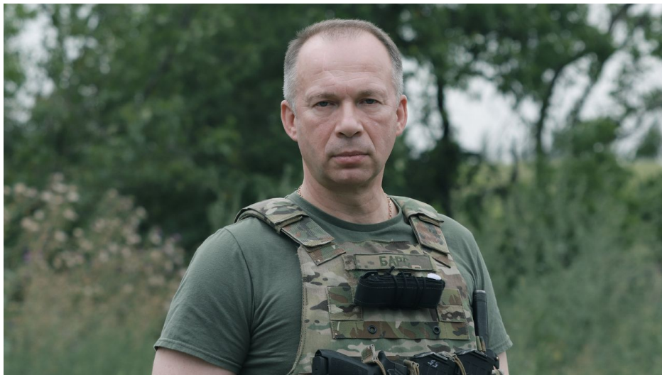
Alexander Syrský, vrchní velitel AFU

Zatím se nedá hovořit o zhroutilí fronty, ale je to počátek vyklízení frontových pozic, přitom Ukrajinci se snaží Rusy zpomalovat, pokud to jde. Ruští analytici přišli s poměrně střízlivou teorií, že jde o vynucenou taktiku, kdy ústup AFU se zastaví uvnitř velkých opevněných měst na Donbasu, tedy ve Slavjansku, v Kramatorsku a v Kupjansku. Tato města jsou silně opevněná a Syrský podle všeho bude chtít vytvořit městskou obranu v očekávání, že v průběhu léta již budou ukrajinské jednotky mít dostatek munice na obranu měst.