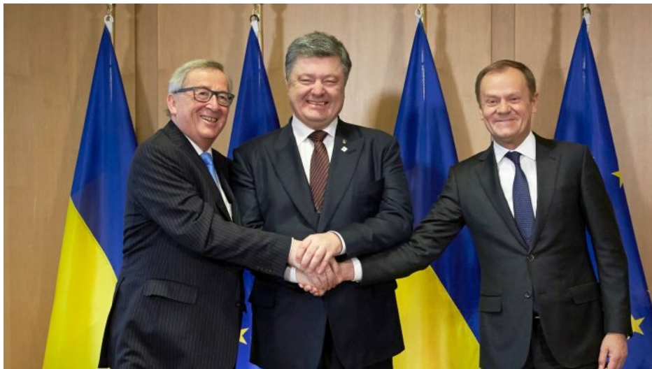
Jean-Claude Juncker, Petro Porošenko a Donald Tusk. Ukrajinský ministr zahraničí Dmytro Kuleba jako ukrajinský ministr zahraničí už rovněž prohlásil [1], že ten balík 61-miliardové pomoci z USA nezajistí výhru proti Rusku. Jeden balík to prý nezajistí. Zajistí to prý pouze sjednocená fronta Ukrajiny a všech jejích partnerů.

Stáčí se podívat na řev polských zemědělců, kteří se děsí vstupu Ukrajiny na potravinářský trh v Evropě. Podle mého názoru bude KoZa chtít na Ukrajině pokračovat v boji, a to do posledního Ukrajince, i kdyby na té frontě měli bojovat invalidé a mentálně postižení vojáci. A to povede pouze k další destrukci a k dalšímu obsazování Ukrajiny ruskými vojsky. Dmytro Kuleba jako ukrajinský ministr zahraničí už rovněž prohlásil [1], že ten balík 61-miliardové pomoci z USA nezajistí výhru proti Rusku. Jeden balík to prý nezajistí. Zajistí to prý pouze sjednocená fronta Ukrajiny a všech jejích partnerů.