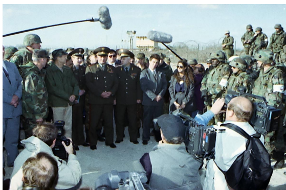
Grachev čelí médiím.