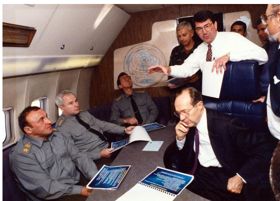
Náměstek ministra obrany pro mezinárodní bezpečnostní politiku Ashton B. Carter informuje Gracheva a Perryho při letu do Kansasu.