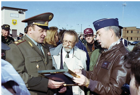
Grachev dostává dárek během své prohlídky letecké základny Whiteman.