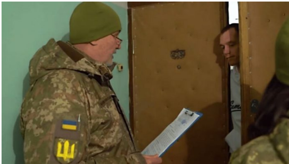
Zaměstnanci odvodního úřadu (TCC) obchází byty s předvolávkami na frontu

A druhou skupinou jsou Ukrajinci, kteří uprchli do zahraničí. Žádná další skupina na Ukrajině není, protože pokus odvést na frontu někoho, kde je připraven se odvodu bránit se zbraní v ruce, jako vidíme v posledních týdnech na západní Ukrajině, je pouze znamením toho, že Ukrajina prostě dostatečné počty lidí nesežene. A právě proto Emmanuel Macron a Radosław Sikorski rozjeli tu akci s misí na Ukrajině, která má kromě jiného i zajistit severní hranici s Běloruskem , a tím má dojít k uvolnění ukrajinské armády, která tam je od roku 2022 prakticky nepoškozená.