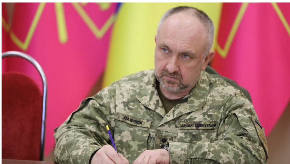
GenPor. Oleksandr Pavljuk

Pavljuk také upozornil na negativní postoj Ukrajinců k pracovníkům územních náborových středisek (TCC), která mají na starosti mobilizaci obyvatelstva. Generál zdůraznil, že takové nepřátelství je nepřijatelné, protože mnozí z pracovníků TCC jsou veteráni, a zdůraznil, že občané "nemají právo vyvolávat v nich pocit viny, nechtěnosti nebo nebezpečí před těmi, kterým doslova zachránili život". Zároveň připustil, že "systém TCC není dokonalý" a že vláda pracuje na jeho zlepšení.