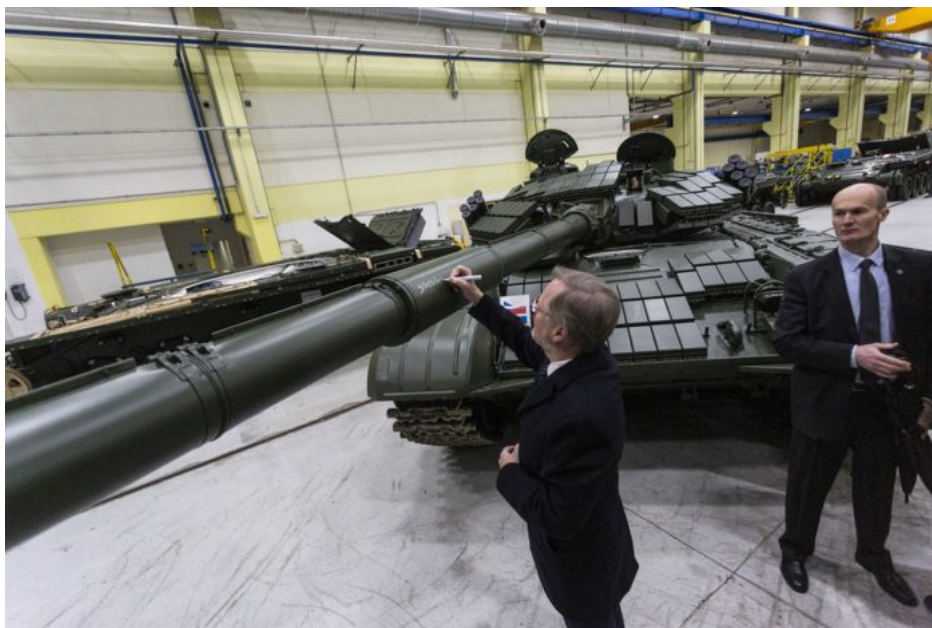
Ukrajině už nestačí posílat jen techniku s podpisem premiéra. Teď bude muset Pěta přemýšlet, jak Ukrajině v té technice poslat i přibalené české vojáky

A tato vojska AFU by se tak přesunula z běloruské hranice na Donbas a na Záporoží. Problém je v tom, že na severu Ukrajiny je podle odhadů asi jen 80 000 ukrajinských vojáků. To není málo, ale na zastavení ruského postupu je podle Pavljuka potřeba minimálně 300 000 vojáků. Otázkou teď je, kde se vezme těch zbývajících 220 000 vojáků. Proto se nedivte, že teď se pořád v EU a pořád dokola přetřásá téma vyslání/nevyslání vojsk NATO na Ukrajinu, protože zkrátka zbraně, munice a prašule už Ukrajincům nic neřeší. Chybí jim maso! A věřte mi, když vám říkám, že Fiala dnem i nocí nespí a přemýšlí, jak to zařadit, aby Ukrajina maso dostala.