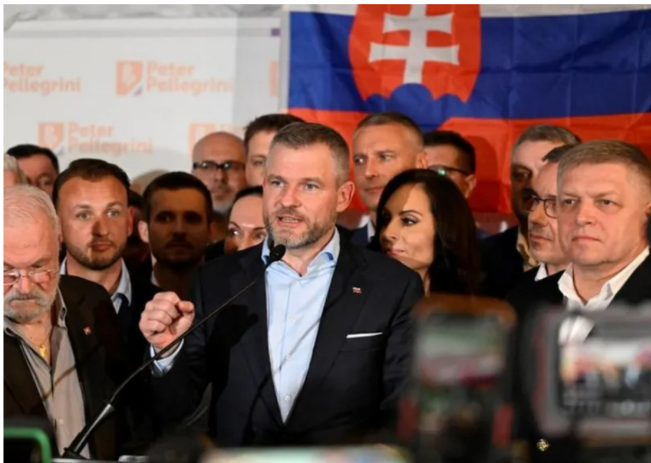
Peter Pellegrini is an ally of Prime Minister Robert Fico

Řev z BBC: Slováci si zvolili populistického prezidenta, který je přátelský k Rusku