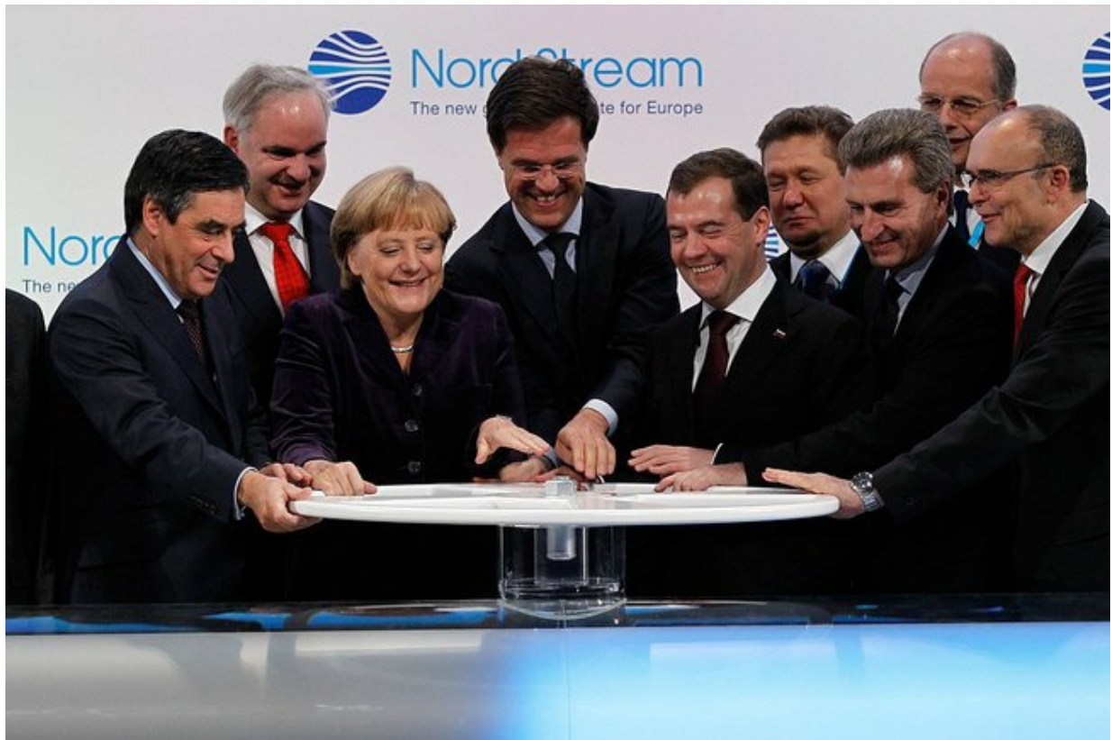
Slavnostní otevření Nord Stream – Rutte uprostřed.

Marku Rutte se v Holandsku přezdívá Teflonový Rutte, protože dovede rychle vycítit změny politických větrů . Když se před lety slavnostně otvíral Nord Stream I, Rutte dokonce přestříhoval jeho pásku! Když Putin zahájil “osvobozování Ukrajiny”, Rutte vřískal nejvíc ze všech. Když nyní v důsledku politiky Bruselu krachuje evropská ekonomika, Rutte pochopil, že stejně jako v roce 2008 jediná záchrana nizozemské ekonomiky spočívá v růstu holandského exportu do Číny, a neváhal letět do Pekingu vychvalovat Prvního Číňana Xi . Ve stejný den, kdy Xi v Pekingu chválili američtí jestřábové i Rutte, byla v Pekingu i nejmocnější současná Sorosova loutka Kristalina Georgieová , šéfka mocného washingtonského MMF . A ta Xi prosila, aby Číňané více posílili svoji osobní spotřebu, místo toho, aby expandovali svoji výrobu a export – jinak hrozí vážné problémy ve světové ekonomice! Přeloženo pro laiky = Číňané musí konzumovat více západního zboží a méně svého zboží exportovat do zemí Afriky, Ameriky a Evropy, jinak bude západní globální ekonomika krachovat. Pomineme-li ironickou skutečnost, že Kristalinu Georgieovou od včerejšího poledne musí pirátský elév Lipavský také zapsat na fialovou listinu “bezpečnostních rizik” pro ČR, je třeba se ptát, proč žádný český politik nebyl včera v Pekingu, když tam byli všichni, aby zajistili svým občanům práci a lepší platy?!