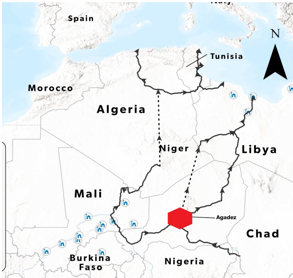
Trasy pašeráků migrantů do EU – červeně vyznačená hlavní americká válečná základna v Africe – náhoda? – Pro ji Putin chce?

Podle amerických válečných analytiků nyní hrozí, že Putin ovládne nejen US válečnou základnu Agadez v Nigeru, ale s ní ovládne i migrační trasy nelegálních imigrantů do Evropy! Brusel se bojí, že Putin tak v případě potřeby, zaválí v rámci hybridní strategie Itálii a Francii miliony uprchlíků. 8. března 2024 na slyšení generálů Kurilly a Langley ve vojenském výboru Kongresu USA bylo oficiálně přiznáno, (viz záznam – Dan Sullivan), že USA nyní vedou proti Rusku na Ukrajině proxy válku, ale že se jí nedaří vést stejně úspěšně jako vedou Irán, Rusko a Čína proti USA a EU své proxy války na Blízkém Východě, a v Africe – viz odpověď generála Kurilly. Hlavní Putinovou devizou v této hybridní válce jsou miliony mladých našťvaných Afričanů a Arabů, kteří jsou bez práce, a bez naděje na budoucnost. Ze své situace viní Západní kolonizátory, a udělají vše myslitelné, aby se svého údělu zbavili. Podle obou US generálů nelze Putinovu tlaku bez mimořádných výdajů, na které nejsou prostředky, vojensko-ekonomicky v obou oblastech čelit, protože hybridní operace Iránu, Číny a Ruska ke svému provedení čerpají místní ekonomické zdroje, a nespokojenost mladých a chudých lidí, a jejich nenávisť k Západu. Obdobná situace je ale i v oblasti bývalé sovětské střední Asie. I tam jsou obrovské mnohamilionové masy nezaměstnaných chudých mladých lidí bez budoucnosti, a ti jsou