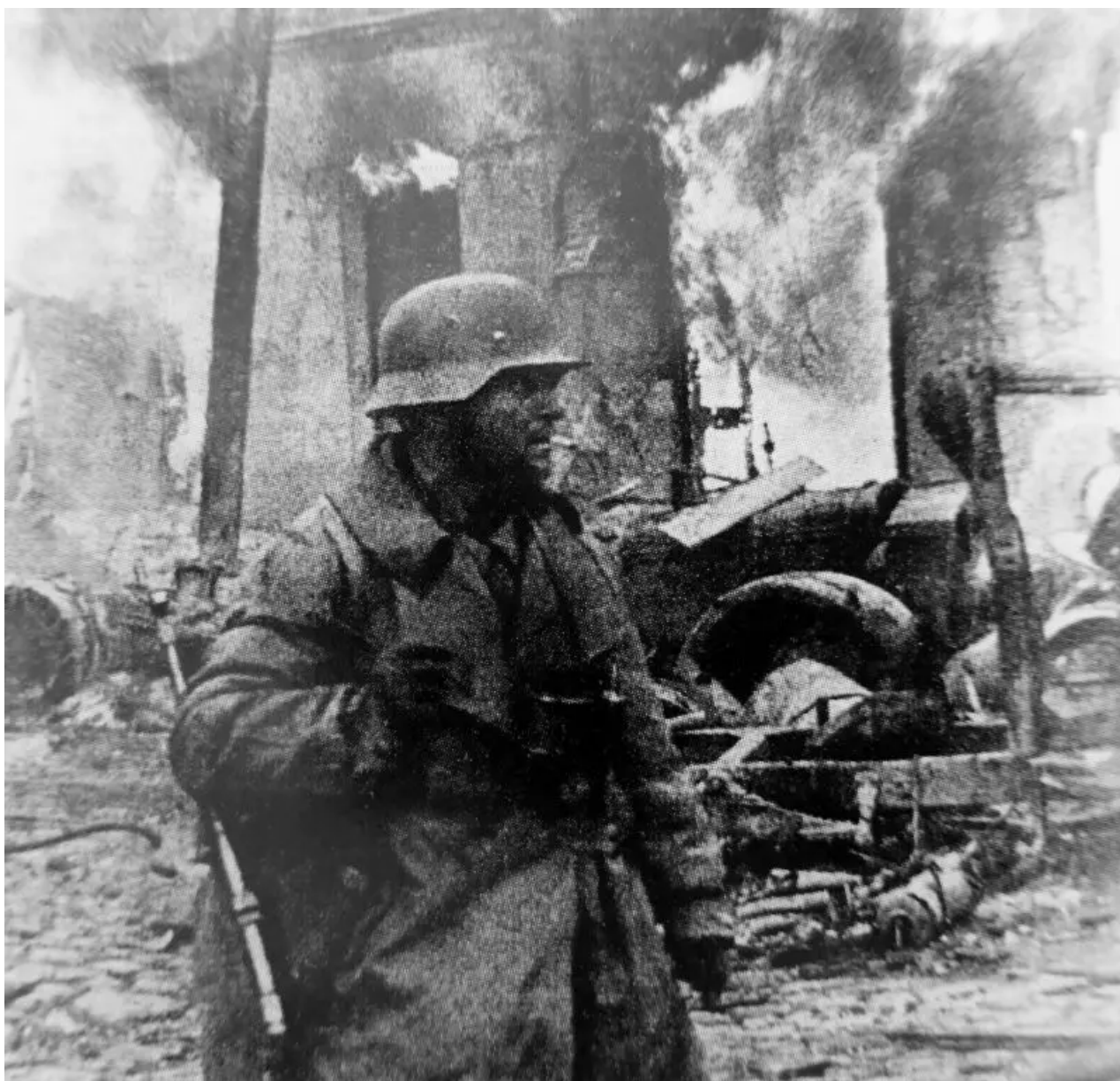
Německý voják poblíž hořící budovy na ulici Žitomir. prosince 1943

Kvůli dešťům a blátivým cestám nemohlo letectví plně podporovat pozemní síly. Mnoho nezpevněných letišť je mimo provoz. Bahno překáželo i mobilním jednotkám, které nemohly vyvinout maximální rychlost pohybu.