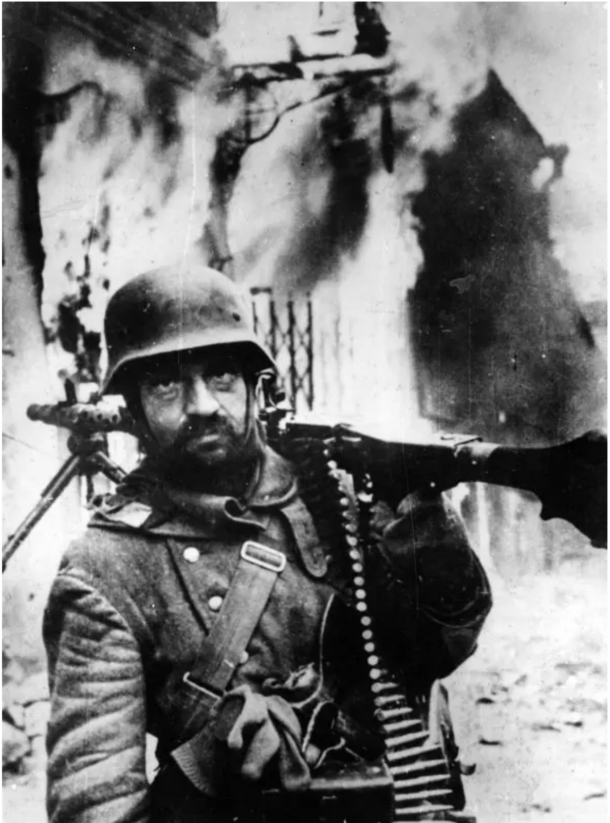
Německý kulometčík v centru Žitomiru. prosince 1943

Velitel 38. armády Kirill Moskalenko připomněl: