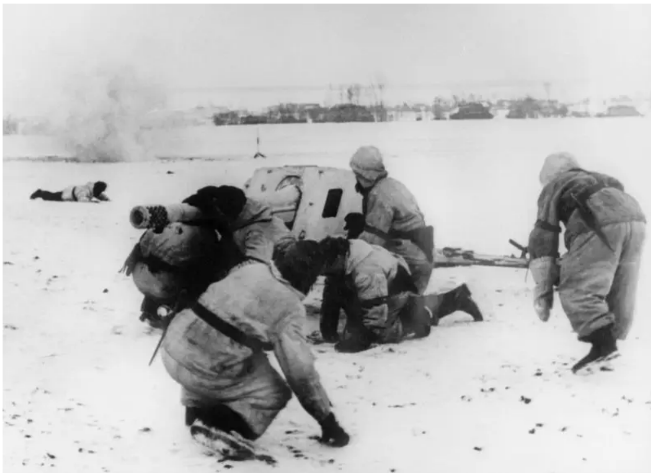
Posádka německého protitankového děla 75 mm PaK 97/38 (7,5 cm PaK 97/38) pod palbou sovětského dělostřelectva v oblasti Berdičev. ledna 1944