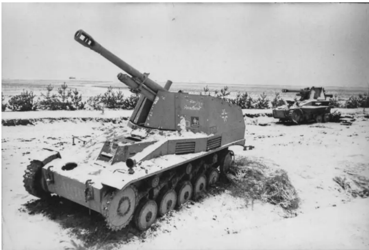
Německá samohybná děla 105 mm Vespe (Sd. Kfz. 124 Wespe) vyřazena a opuštěna západně od Žitomiru. Nedaleké samohybné dělo neslo vlastní jméno – „Annelisa“. 1. ukrajinský front. 1944

Po čtyři dny útočily jednotky 40. armády na nepřátelské pozice a odrážely jeho protiútoky. 4. ledna sovětsí vojáci osvobodili Bílou Cerkva. 7. ledna 27. armáda na levém křídle osvobodila město Ržiščev od nacistů a spojila se s jednotkami, které obsadily předmostí Bukrin.