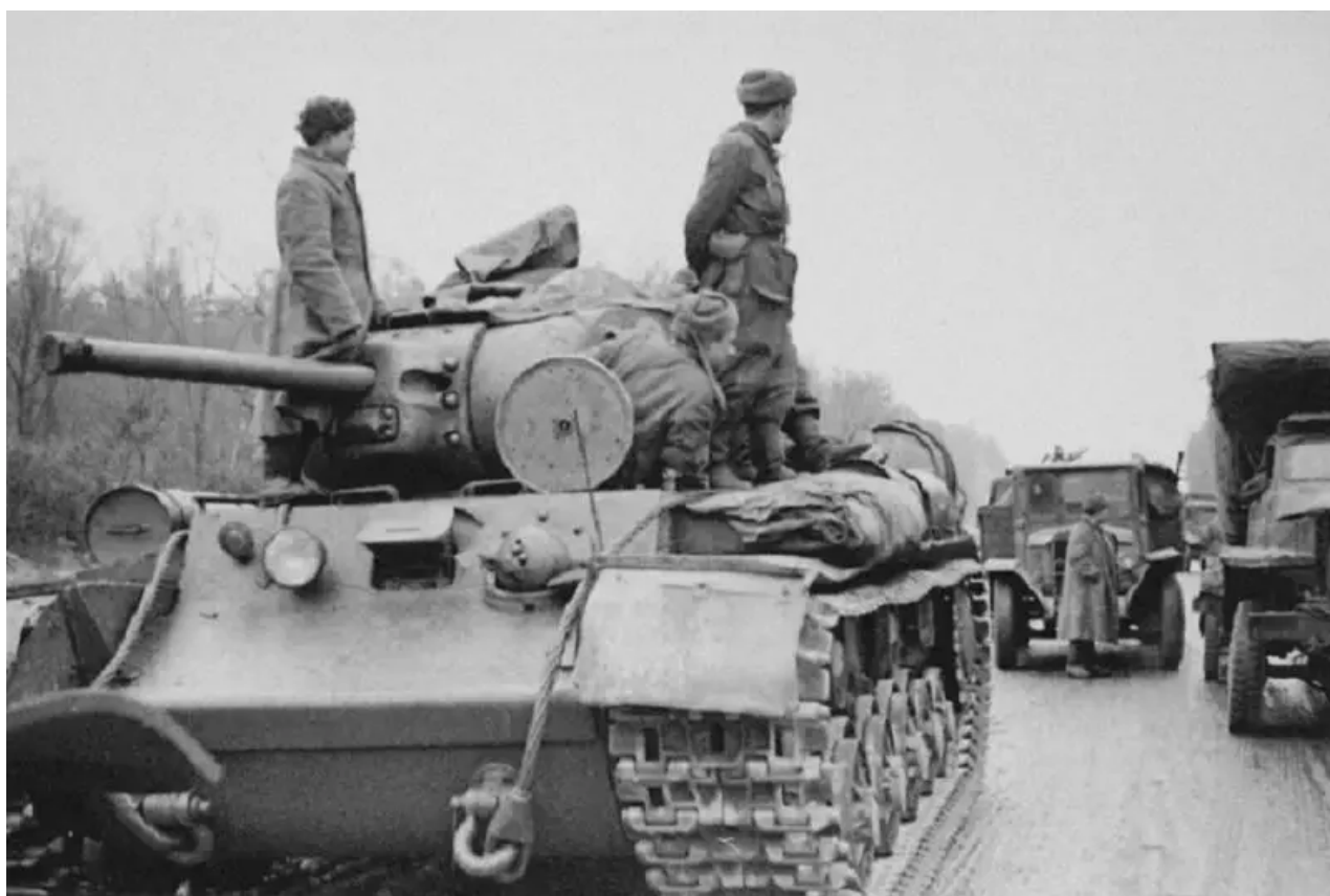
Sovětská tanková posádka na pancíři tanku KV-1S jednoho z tankových pluků průlomu 1. ukrajinského frontu při pochodu na dálnici u Žitomiru. listopadu 1943

Sovětské velitelství zahajuje strategickou dněprsko-karpatskou operaci s cílem osvobodit pravobřežní Ukrajinu ( bitva za osvobození pravobřežní Ukrajiny ). První operací byla operace Zhytomyr-Berdičevskaya. Aby se vyloučila možnost nového nepřátelského útoku na Kyjev, bylo rozhodnuto tuto možnost jednou provždy skoncovat a zničit německou 4. tankovou armádu generála E. Routha, odhodit zbytky nepřátelských sil do jižní Bug.