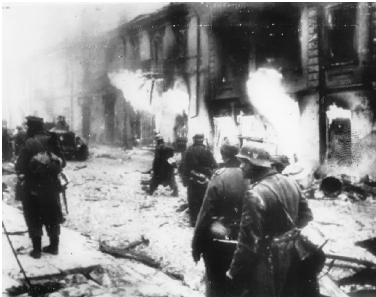
Němečtí vojáci na ulici hořícího Žitomiru. prosince 1943

Německé divize byly zbaveny krve tvrdohlavými boji v listopadu a prosinci 1943, kdy se Wehrmacht pokusil dobýt Kyjev a vrátit linii Dněpru. Nacisté neočekávali, že Rusové budou schopni okamžitě odrazit protiútoky Wehrmachtu a zahájit silnou ofenzívu. To předurčilo úspěch Rudé armády.