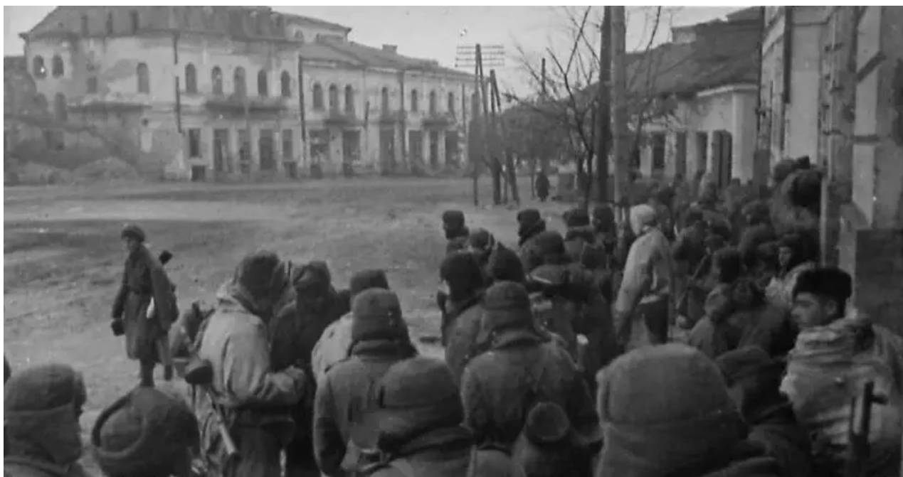
Sovětští pěšáci na Berdičevově ulici. ledna 1944