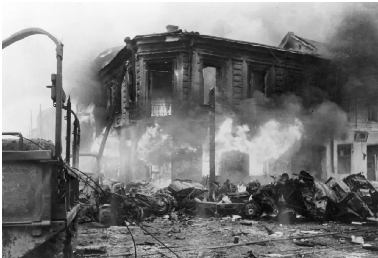
Zničená sovětská vozidla v Žitomiru zajatá německými jednotkami. listopadu 1943

Vatutinův 1. ukrajinský front (1. UV) však po těžkých listopadových bitvách nedokázal tento problém vyřešit sám. Proto byl 1. UV výrazně posílen. Pod Vatutinovo velení byly převedeny Leselidzeho 18. armáda, Katukovova 1. tanková armáda a také 4. gardový tank a 25. tankový sbor.