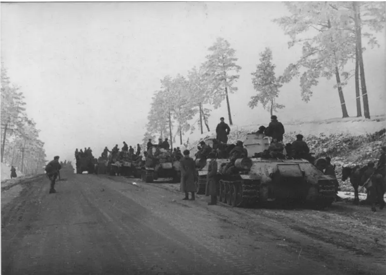
Sovětská tanková jednotka s jednotkami v brnění na dálnici Žitomir poblíž Kyjeva

Německé velení navíc vyčerpalo téměř všechny zálohy, které už byly malé, což ovlivnilo průběh dalších bojových akcí (ve prospěch Rusů). K odrazení nových sovětských útoků museli Němci přesunout jednotky ze západní Evropy nebo oslabit jiné směry.