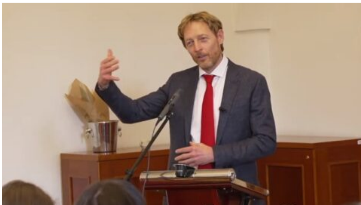
Člověku, kterého ovládne strach, se zásadně snižuje IQ, upozorňuje Janeček na manipulaci strachem