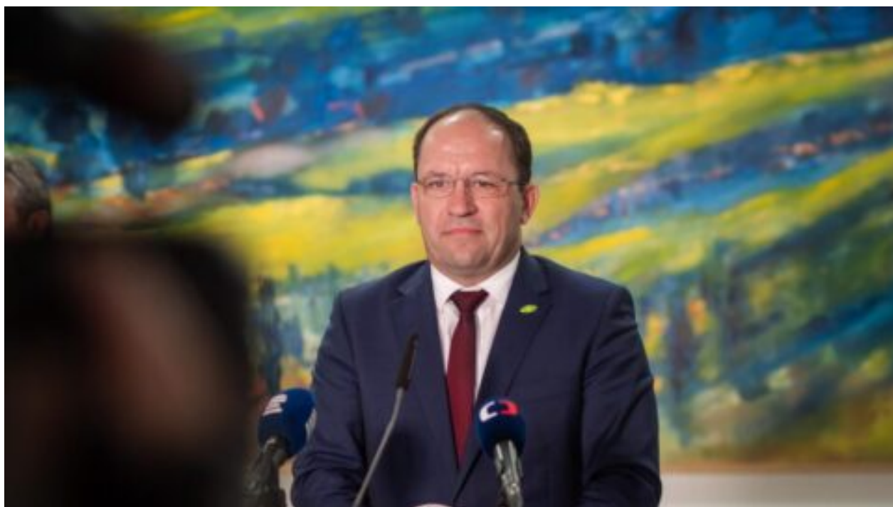
Výborný: Ministerstvo zemědělství chystá soubor opatření, který farmářům sníží administrativu