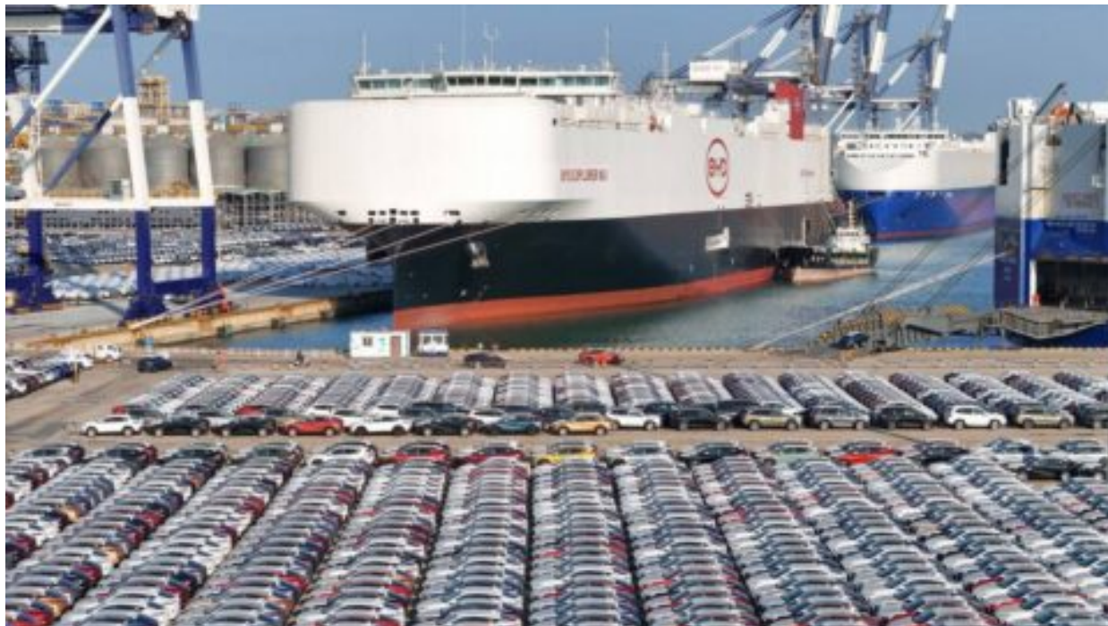
Čína chrlí do světa své dotované elektromobily, země zavádějí protidumpingová opatření