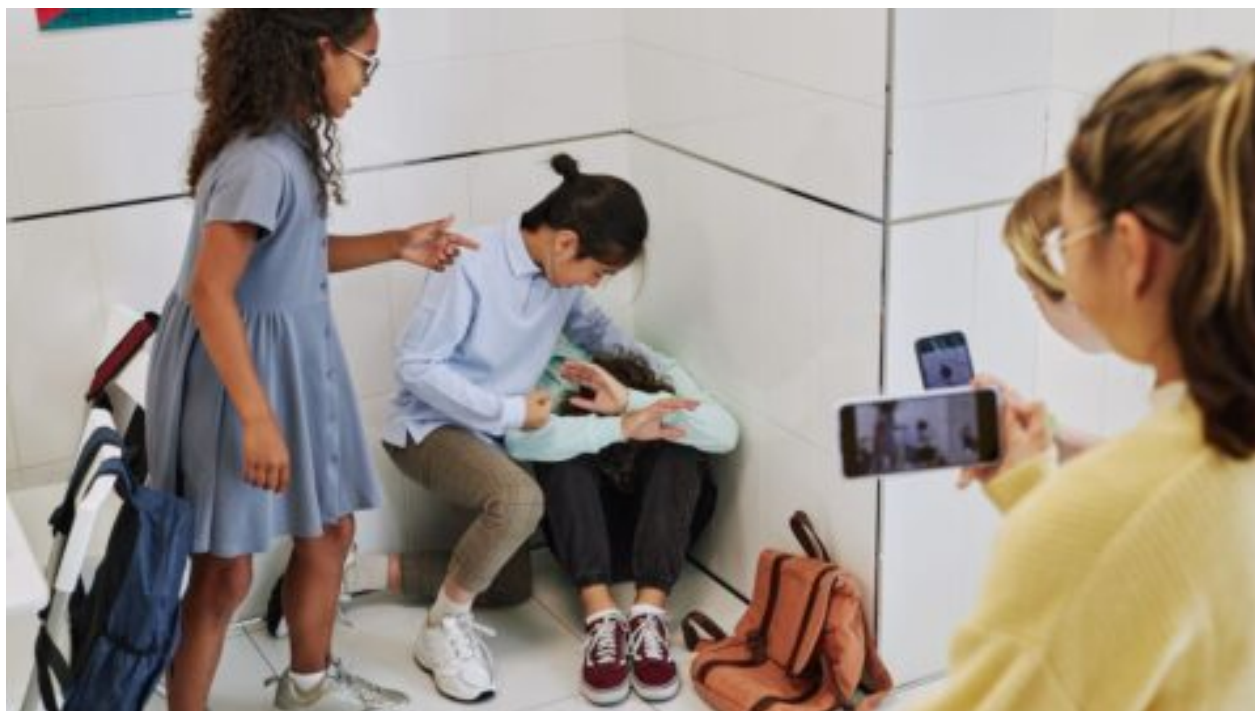
Násilí v německých školách je horší, než se očekávalo: „Mnoho škol se bojí, že si poškodí image“