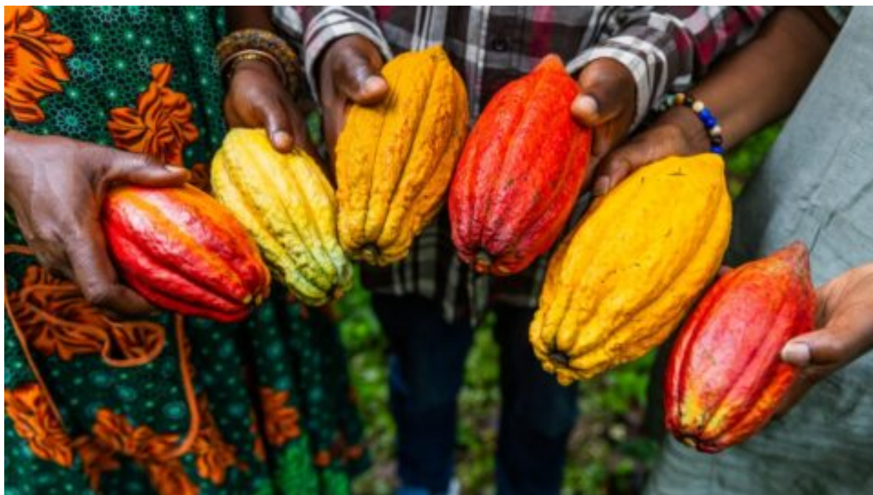
Otrocká práce, těžké kovy, kontaminace. Problémy s logem zelené žabičky?