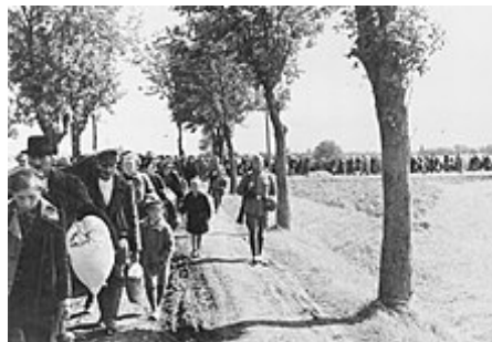
Vysídlení Poláků z Velkopolska

Malý plán se začal jako první realizovat v Polsku , kde bylo v rámci operace Tannenberg popraveno přes 20 tisíc příslušníků polské elity. Po ní následovala akce „Intelligence“, při níž bylo zabito přes 40 tisíc polských intelektuálů. Německá okupační moc zavedla v Polsku, resp. v Generálním gouvernementu a na okupovaných polských územích politiku teroru, přičemž prováděla hromadné veřejné popravy i exekuce rolníků, které měly zstrašovat ostatní obyvatelstvo. Postupně docházelo k vysídlování z oblastí určených k další germanizaci a násilnému zabírání zemědělské půdy, přičemž bylo ze svých domovů vyhnáno několik stovek tisíc Poláků. V roce 1941 bylo rozhodnuto, že dojde k úplnému zničení polského národa a v Polsku zůstanou 3 - 4 milióny Poláků, kteří budou sloužit německým kolonistům jako otroci. Jedním z kroků tohoto plánu bylo násilné odebrání rasově "vhodných" polských dětí na "převýchovu" do německých rodin. Násilnická politika vůči Polákům vedla k tomu, že Polsko mělo vedle SSSR největší procentuální ztráty civilistů ve druhé světové válce, jejich počet činil 5,6 mil. (z toho 3 mil. Židé). K dalším zemím s největším počtem zabitých civilistů patřila Jugoslávie s půl miliónem mrtvých (převážně Srbů).