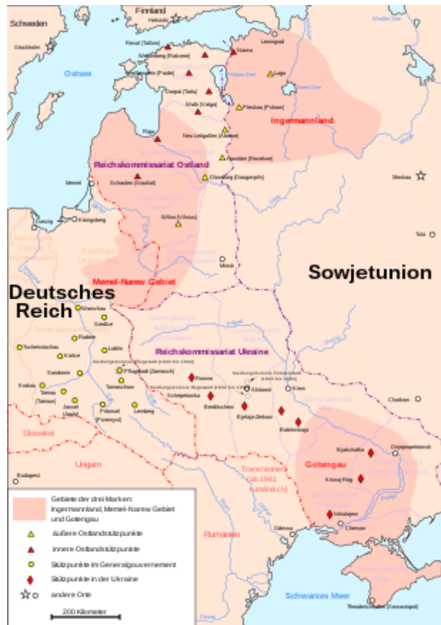
Mapa k dokumentu 5: Generální plán Východu se základními a pochody v Pobaltí , Polsku , Bělorusku , Ukrajíně a Krymu (Plánování institutu pro zemědělství a agrární politiku Humboldtovy univerzity v Berlíně)

Generalplan Ost (GPO) byl německý plán genocidy obyvatelstva teritorií okupovaných Německem ve východní Evropě během 2. světové války a po jejím ukončení a kolonizace těchto území německým obyvatelstvem. Akce byla připravena v roce 1941 a schválena o rok později. Plán navazoval na Hitlerovy plány Lebensraum a měl být splněn po uskutečnění záměru okupace východní Evropy - plánu Drang nach Osten . Generalplan Ost vycházel jednak z nacistických plánů o osídlení Evropy germánskou rasou, jednak z rasových předpokladů, podle nichž byli Slované nižší rasou - podlidi, něm. Untermensch .