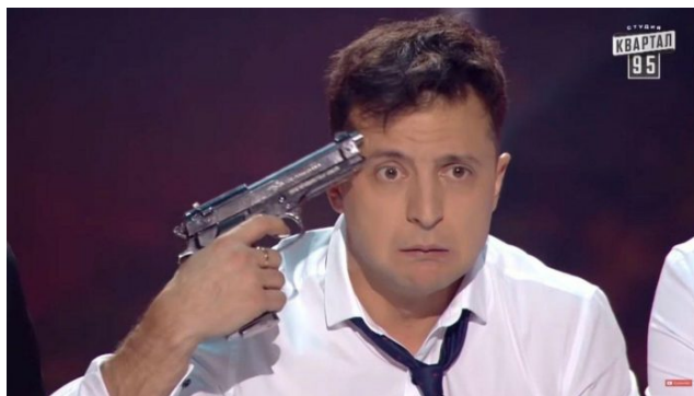
Tahle původně komická scénka by se pro Zelenského mohla stát brzy realitou

A když vidí, že Američané se od něho odvrátili, nerad by dopadl jako jiní prezidenti, kteří dopadli hodně špatně, když se od nich američtí bratři odvrátili. Válku by Ňuchačenko vedl klidně dál a posílal by tam klidně i ženy a děti. Jenže pouze za situace, že má plnou podporu USA a jejich ochranu. A protože ji už podle všeho nemá, nezbyvá mu nic jiného, než začít šlapat na brzdu k ukončení války.