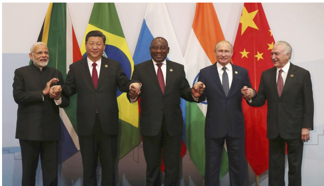
Prezidenti zakládajících zemí skupiny BRICS

Ano, tyto kondicionály v Zelenského rozhovoru, za jakých podmínek může Ukrajina vyhrát a Rusko porazit, jsou signálem Ňuchačenka k ukončení války! A víte proč? Protože kdyby vítězství záleželo jen na dodávkách a dostatku zbraní a munice, tak by to pro Američany nebyl problém zajistit.