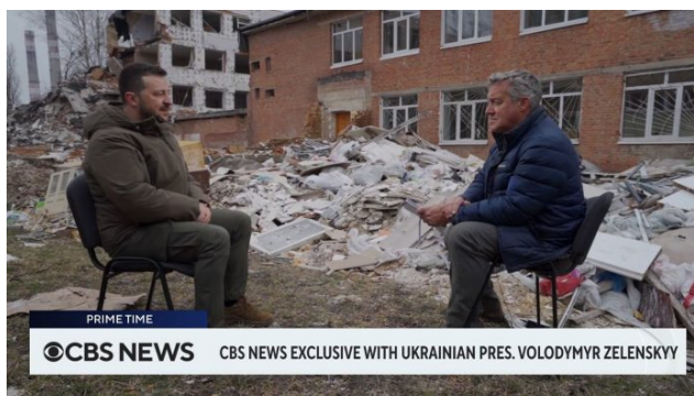
Rozhovor Zelenského pro CBS

Zelenského odpověď zkrátka byla vodou na mlýn Donaldu Trumpovi a Republikánům, že posílat zbraně na Ukrajinu nemá smysl, protože zbraně a munice samy o sobě už Kyjevu válku nevyhrají. A v tomto rozhovoru tento argument najednou zazněl od samotného Zelenského! Ukrajínští novináři už začali mluvit o tom, že Zelenskyy chce válku ukončit, ale pouze tak, aby z kapitulace nebyl obviňován on, ale právě Američané a kongresmani. A to nebylo všechno.