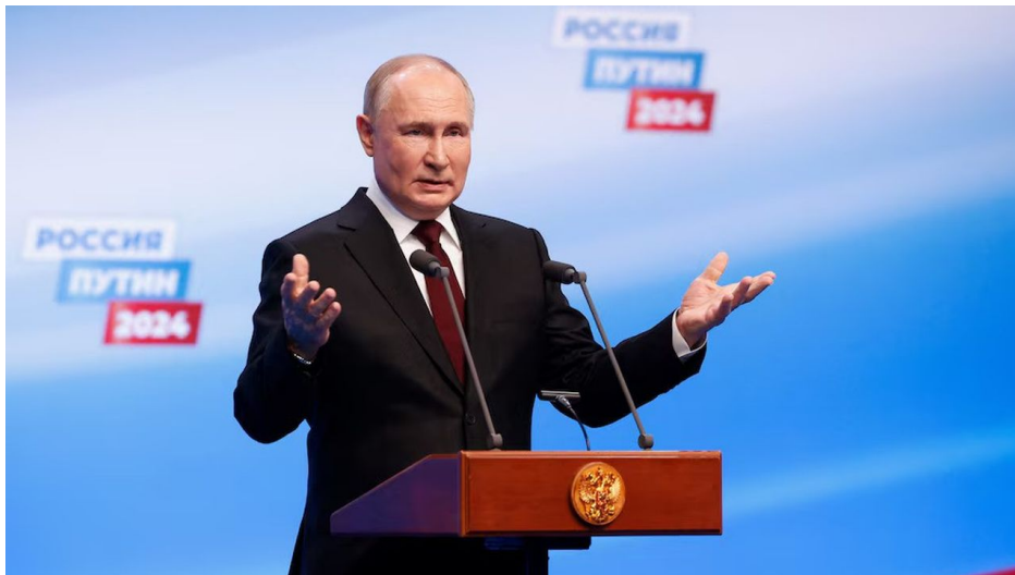
Vladimir Putin během vítězného projevu

Ruský národ je prostě lehce čitelný a pouze tupí západní politici nechápou, že Rusko nelze porazit metodami válek, a to ani těmi hybridními. Kdykoliv někdo zaútočí na Rusko, tak ruský národ se semkne okolo vůdce, bez ohledu na to, jestli vůdce milují, nebo k němu mají rezervy, anebo jestli ho i nesnáší. Zeptejte se mnoha Rusů, proč volí Putina.