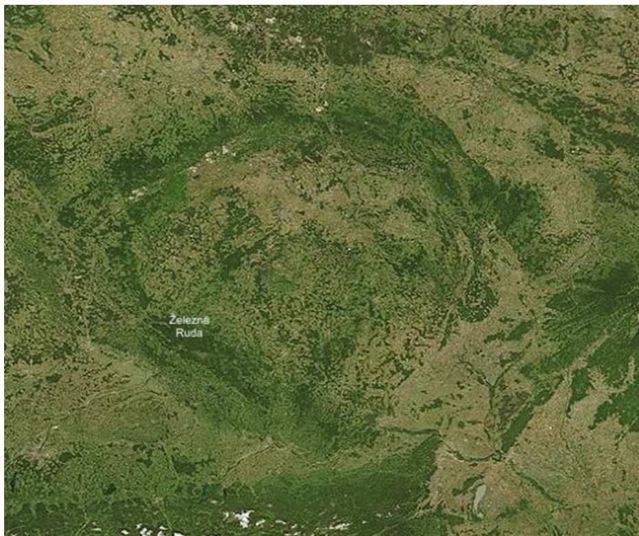
Topografická mapa prostoru Českého kráteru

Ruský svět je definovaný jiným prostorem a prostředím, které ovlivňuje ruský genom jinak než v západních zemích. A když jdou k volbám Rusové, je to proces na záchranu Ruska a tradiční rodiny. Zato když jdou k volbám Češi, a to ve chvíli ohrožení svého národa fašisty z Bruselu a hrozbou války s Ruskem, tak... tak na to si odpovězte opět sami, jak ti Češi většinou a majoritně v takové chvíli volí. Nemluví o vlastencích a probuzených lidech, ale o majoritě české populace. A to je realita!