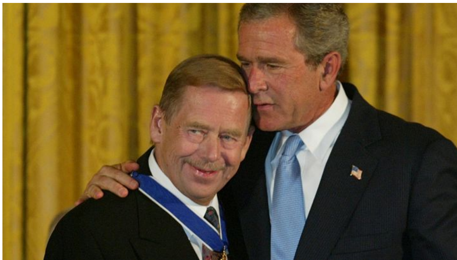
Václav Havel se přimkl ke Georgi Bushovi ml.

Češi se v roce 1968 na pokyn Dubčeka a ÚV opět chtěli okolo něhoho semknout, ale už zase nebylo okolo koho, protože Alexander Dubček po 21. srpnu prostě složil funkci a zabalil to jako kdysi Beneš. A když v roce 1989 padal režim, lidé se semkli okolo dramatika Václava Havla. Řekl nám, že naše země nevzkvétá. Co by řekl o naší zemi dnes po 35 letech, to nechám na vaší fantazii. O deset let později od roku 1989 se už začalo mluvit o " blbě náladě " ve společnosti, což bylo krycí označení pro " rozkradení republiky " ve chvíli, kdy Evropská unie kutila a kuchtila Lisabonskou smlouvu. Namísto toho, aby se národ přimkl k vůdci, tak se naopak vůdce přimkl sám k řediteli planety, k prezidentovi USA v té době, viz. všefkající foto níže.