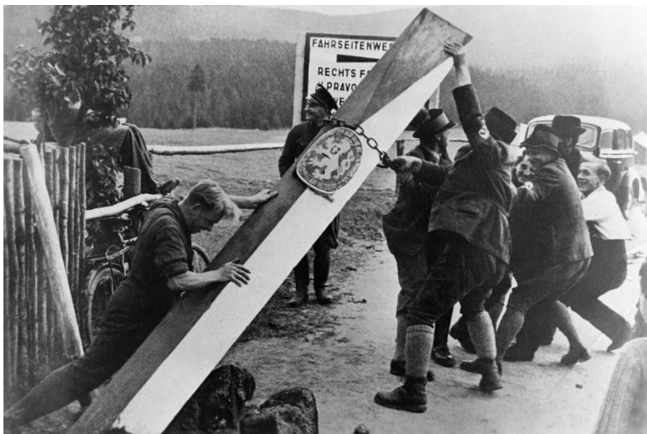
Freikorps a místní Němci ze Sudet vyvracejí český hraniční sloup po podpisu Mnichova.

Germanizace byla tak obrovská, že dokonce i v době Národního obrození zaznívaly od "vlastenců" argumenty pro zachování svazku s Habsburskou monarchií, a to i přesto, že v roce 1848 nedostaly české a moravské země, na rozdíl od Uher, federativní samostatnost v rámci monarchie. Velká část tehdejších vlastenců stále věřila v mocnářství. A to nebylo všechno.