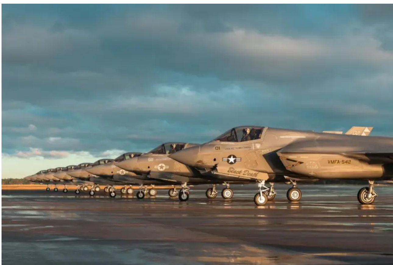
Americké stíhačky F-35A připravené k účasti na cvičení

Obecně platí, že pořádání cvičení NATO na pozemních cvičištích ve Skandinávii nebo v Barentsově moři není nic nového ani překvapivého. Podobné akce se konají pravidelně. Například cvičení Nordic Response se koná každé dva roky a není jediné svého druhu. Tyto okolnosti však neodstraňují důvody k obavám.