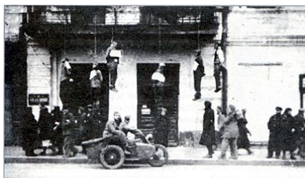
První den okupace Charkova: oběšen na balkonech Sumské ulice . 25. října 1941