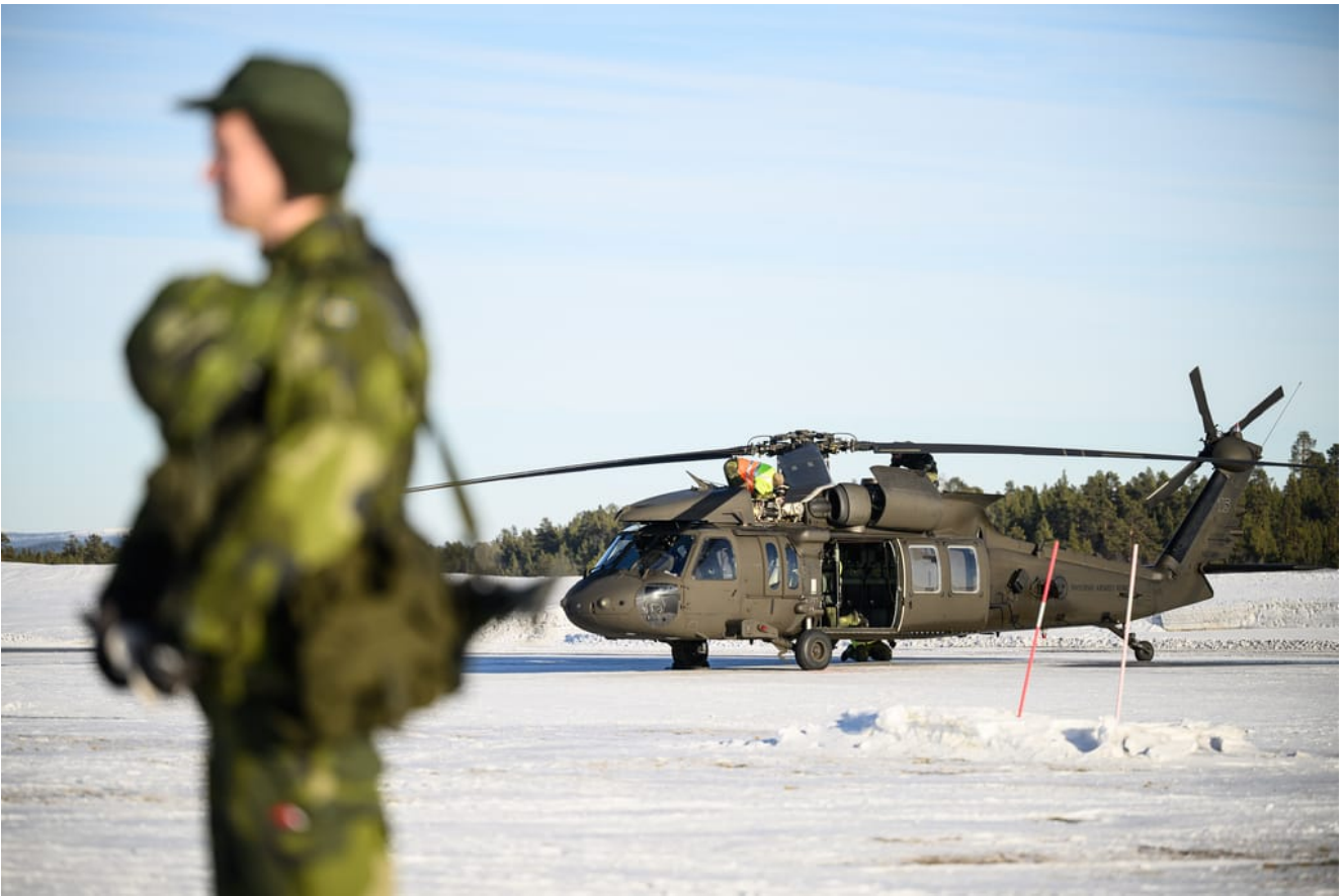
Vrtulník Blackhawk UH-60 v Kiruně

Kromě symboliky narůstajících řad a posílené baltské fronty jsme se podívali na čísla, abychom viděli, co dalšího může NATO od svého nového spojence získat.