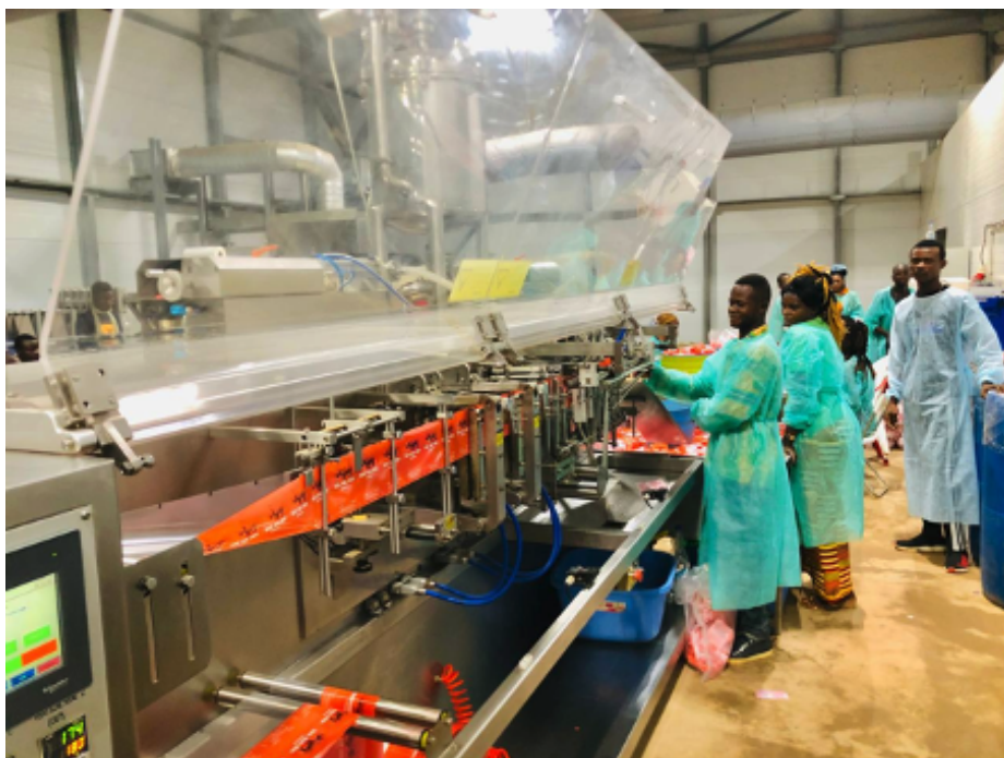
Ruský Prigožinův pivovar v Bangui produkuje 50 000 litrů denně.

Tajná Putinova zbraň na ovládnutí Afriky – ruské pivo a pivovary decimují v Africe francouzské pivovary! Srovnání cen vlevo ruské pivo, vpravo francouzské pivo.