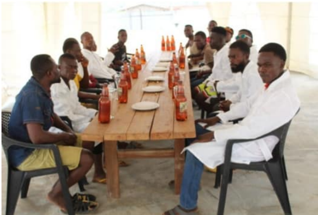
Degustace ruských piv je doporučovaná místním mladým lidem i tamní vládou a politiky!