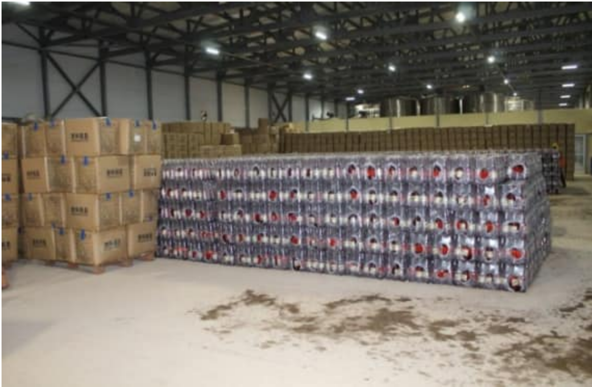
Distribuční sklad ruského pivovaru v Bangui. Vaří i nealkoholické pivo pro muslimy!