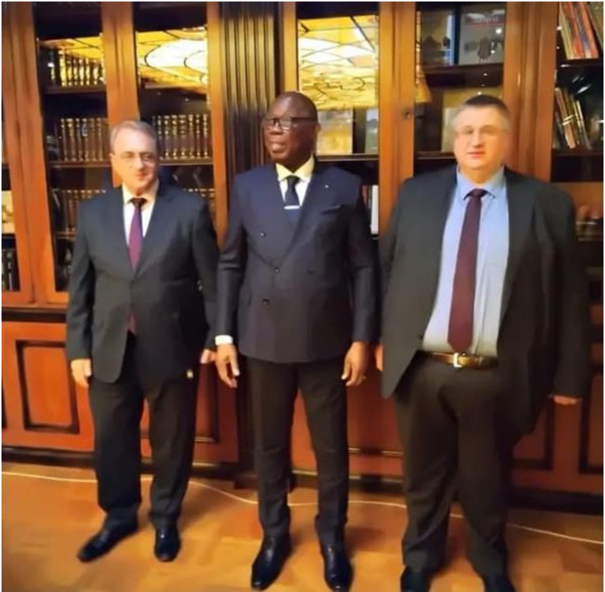
Putinovi vysoce postavení vyslanci jednají s místní vládou takřka každý týden.