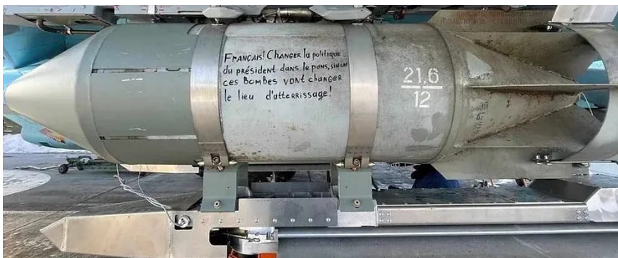
Kazetová bomba RBK-500 z videa, s krásně viditelným kluzákovým modulem UMPK. Bomba byla svržena na francouzské specialisty na Ukrajině.

Další v čem se Švamberk mýlí je jeho přesvědčení, že SU-34 musí cíl, na který bombu svrhává, ozařovat laserem, že odhoz musí provádět ze vzdálenosti nejvíce 40km, a že po dobu klouzání bomby k cíli, musí cíl ozařovat aspoň ze střední výšky, a je tak vystaven sestřelení. Jde opět o staré údaje platné pro bomby 2. generace z roku 2023. Rusko nyní používá hlavně FAB-500M62 třetí generace, která má satelitní navigaci na cíl, s rozptylem od cíle 10 metrů, vzhledem k síle výbuchu irelevantním, tudíž je bombou typu “odhod’ a zapomeň”, a letadlo po shozu ve vzdálenosti 40 až 60km od cíle ihned obrátí a ustupuje, tudíž s výjimkou SU-200/300 vůbec nevstupuje do palebné zóny Patriot, NASAMS ani dalších západních raket, ve verzích, které byly Ukrajině dodány. Rusko navíc zahájilo testování 4. generace bomb FAB, které už mají pulzační motor, a odhazují se na cíl až ze vzdálenosti 100km.