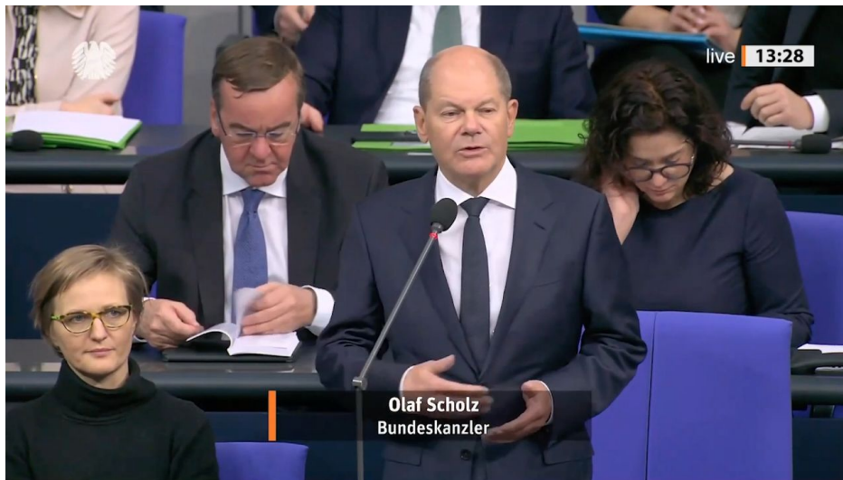
Olaf Scholz, spolkový kancléř

Je to zřejmě ona, která stála za plánem dodávek Taurusů za zády Olafa Scholze a rakety měly být řízeny odtud z Německa z výrobního střediska výrobce raket Taurus v Schrobenhausenu. Německo se tak pokusilo o válečný akt proti Rusku, přičemž plánovalo nejen úder na most na Krymu, ale právě i do hlubokého ruského vnitrozemí. A tyto rakety by byly na cíle naváděny přes německou družici Luftwaffe přímo ze Schrobenhausenu. Ukrajinci by tak vlastně neřídili vůbec nic, pouze by raketu fyzicky vypustili z území Ukrajiny, ale její řízení by potom převzala odtud z Německa přímo Luftwaffe. A to je válečný akt!