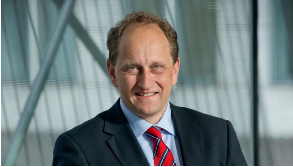
Alexander Lambsdorff, německý velvyslanec v Rusku

“Zda německá armáda jedná z vlastní iniciativy, se teprve uvidí. Pak je otázkou, nakolik je německá armáda kontrolovatelná a do jaké míry to všechno kontroluje (německý kancléř Olaf) Scholz, nebo zda je to součástí německé státní politiky,” řekl Peskov. Německý ministr obrany Boris Pistorius v neděli označil zveřejnění rozhovoru ruskými médii za “informační válku” a slíbil “důsledky” , jakmile bude vyšetřování incidentu ukončeno.