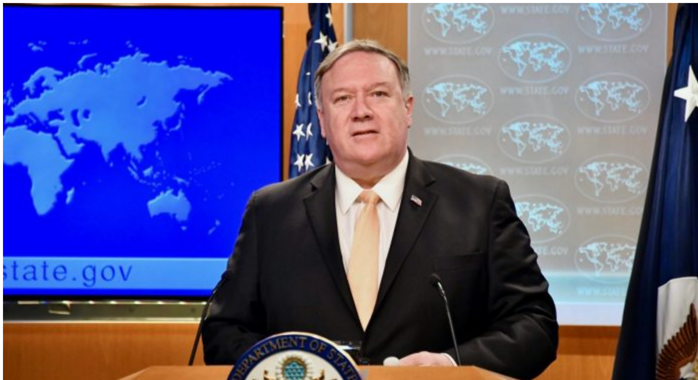
Mike Pompeo, bývalý ministr zahraničí USA