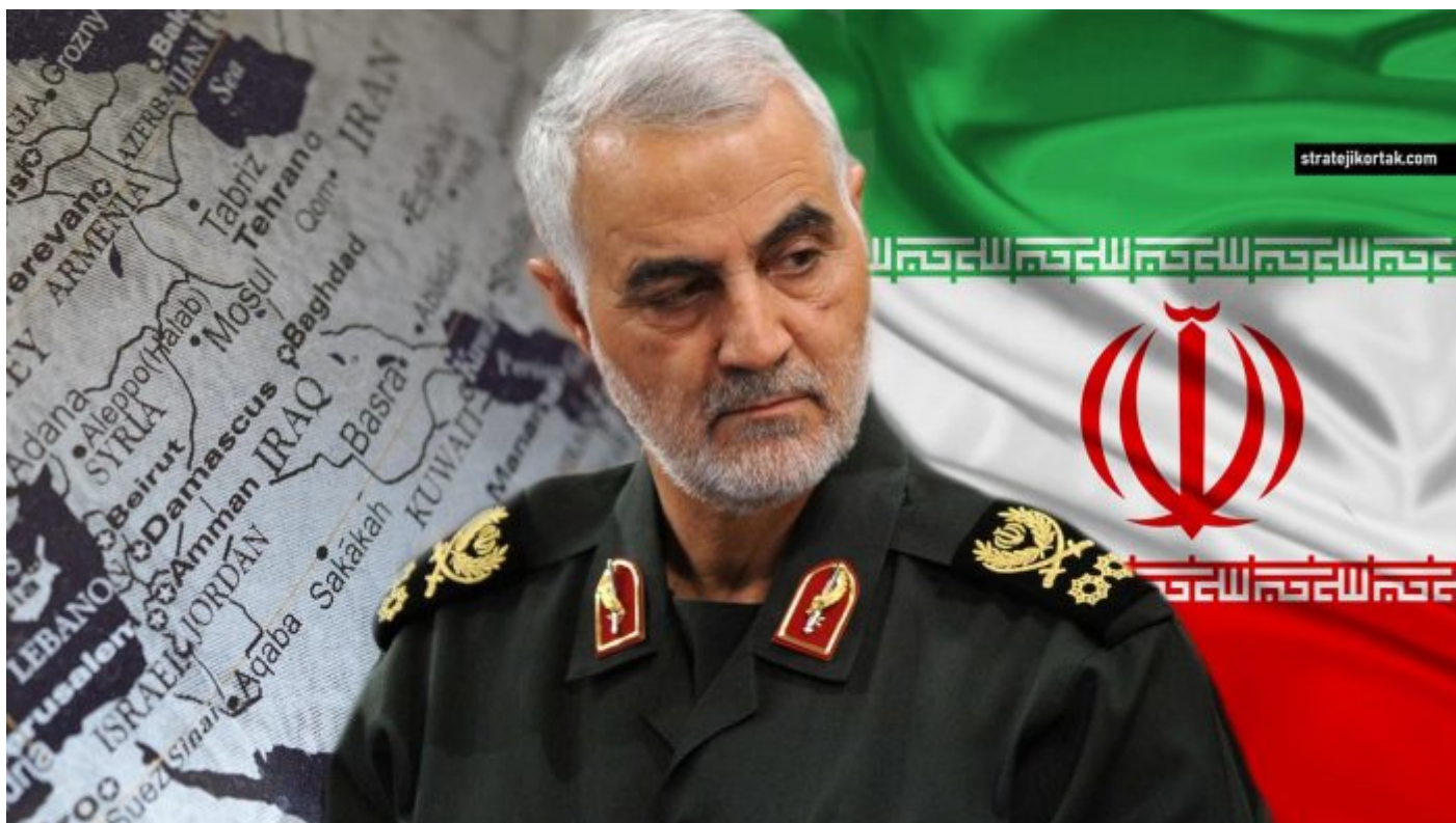
Kásim Sulejmání, bývalý velitel jednotek Quds íránských revolučních gard

V prosinci 2023 byly na Faraháního a dalšího údajného zpravodajského pracovníka uvaleny sankce ze strany ministerstva financí USA. BBC se podle informací obrátila na íránské představitele ve Washingtonu a New Yorku se žádostí o komentář. Íránští představitelé slíbili pomstu za zabití Sulejmáního, který byl v době své smrti všeobecně považován za druhou nejmocnější osobu v Íránu.