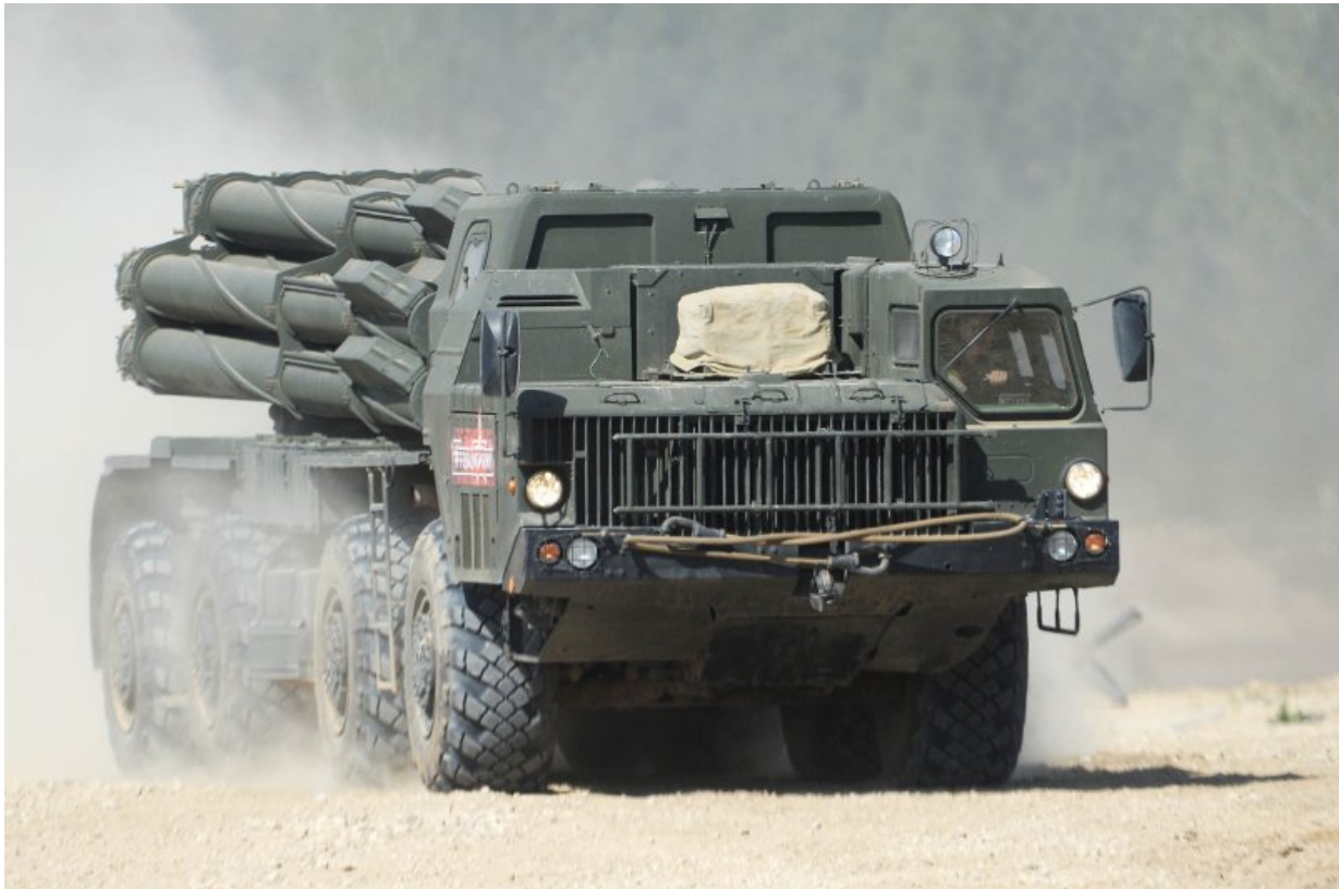
Tornado C – největší ruský MLRS!

Velmi zajímavou zprávu včera přinesly ruské telegramové kanály. Podle ní Putinovy rakety v noci na neděli zlikvidovaly jedinou továrnu na Ukrajině, která vyrábí umělá kolagenová střívkva nutná pro moderní výrobu párků, salámů a dalších uzenin – Белкозин – ve městě Pryluky. Putin tímto úderem dokázal, že má cíle svých úderů dokonale promyšlené a raket má dostatek i na likvidaci méně významných, ale pro zásobování Ukrajiny kriticky důležitých továren.