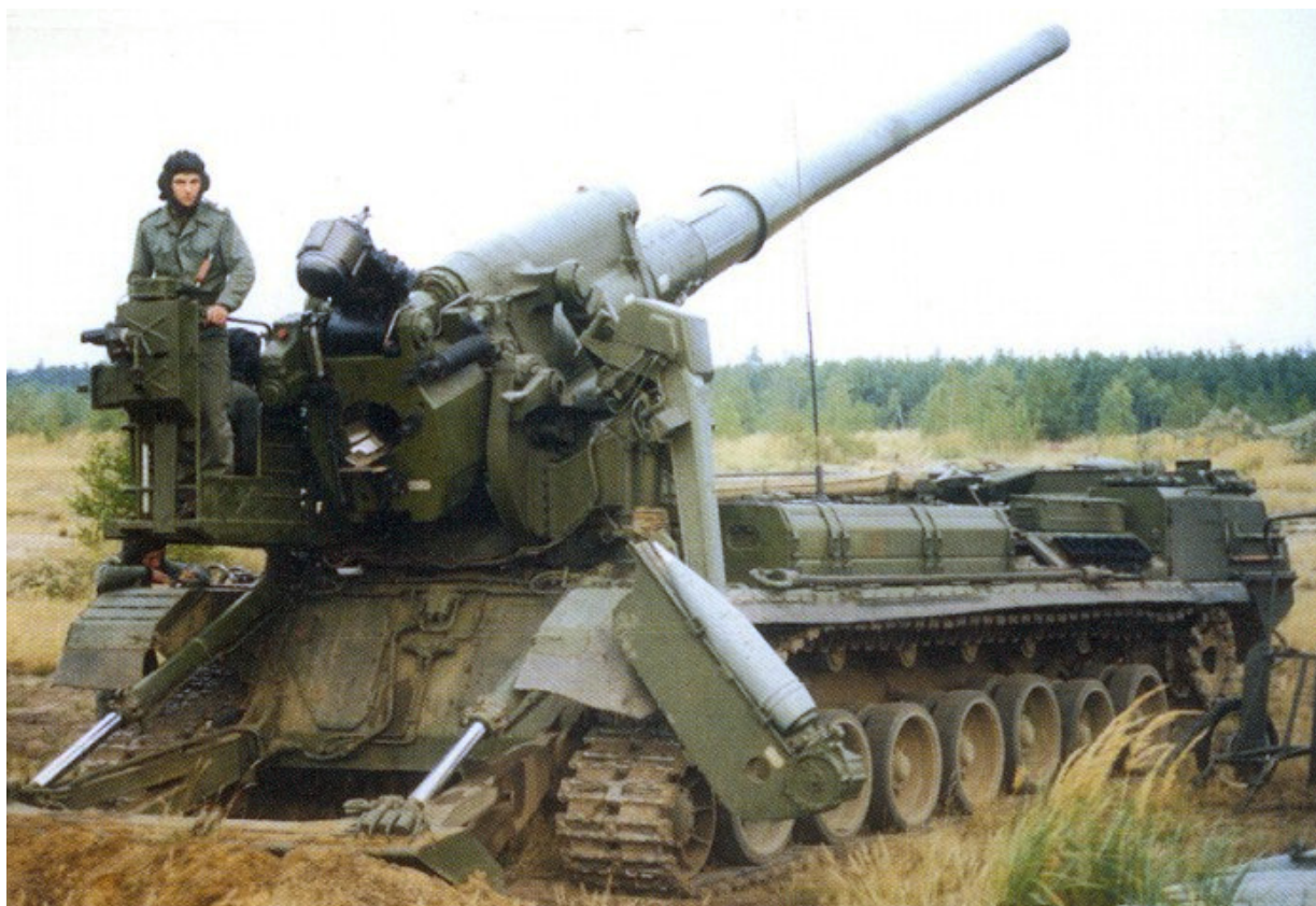
2S7 Malka ráže 203mm dostřel 50km.

Československé raketomety RM-70 Vampir, které Zelenskyj používal k terorizování obyvatel Bělgorodu a Doněcka, včera skončily neslavně. Na frontě se objevily první nové ruské stroje Tornádo C, (dostřel 200km), které jsou výkonnější než US MLRS HIMARS, (dostřel 80km). A jak ukazuje toto video čeští Vampirové s dostřelem max 40km nedostaly žádnou šanci přežít a byli zlikvidováni.