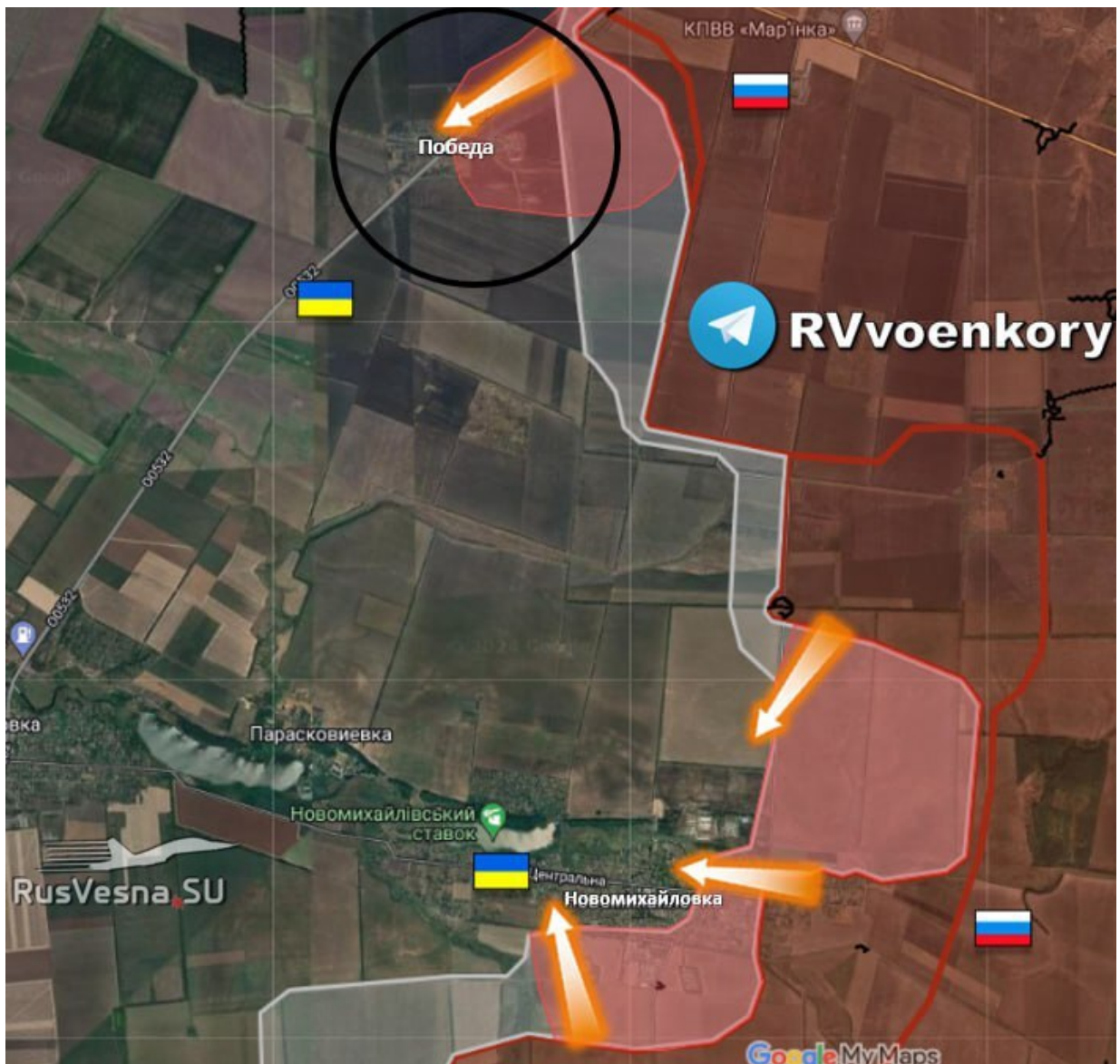
Postup jižně od Doněcka na Vuhledar ze západu.

Jižně od Doněcka, pod v prosinci dobytým předměstím Marjinka, Rusové včera po krátkém urputném boji vstoupili do vesnic Победа a Новомихайловка, a zahájili přes ně postup do týlu ukrajinské pevnosti Vuhledar ze západu. (Mapa nahoře.) Na mapě v levém horním rohu vidíte opět, jako u Ласточкино, vyznačenou klasickou asfaltovou cestu O0532. Rusové tedy vzhledem k počasí postupují podél zpevněných cest. Ukrajinci přitom nejsou schopni tyto úzké koridory, kterými Rusové postupují, ani účinně minovat, ani je bránit, a ani je pustošit dělostřelbou. Tak vypadá typická situace demoralizovaného obránce, kterému došla munice i zálohy, a jehož velení ztratilo schopnost řídit svá vojska na operační úrovni.