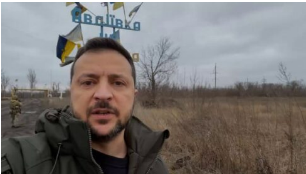
Zelensky poblíž Avdiivka v prosinci 2023

Pokrytecký Kyjev ale nemohl vyhlásit stažení o den dříve, i kdyby to stálo životy tisíců vojáků. Je zřejmé, že západní patroni Kyjeva potřebovali porážku zmírnit. Kyjev proto čekal na Navalného smrt v ruském vězení a mnichovskou bezpečnostní konferenci, kde mohl maximálně využít poslední Navalného „mediální bombu“.