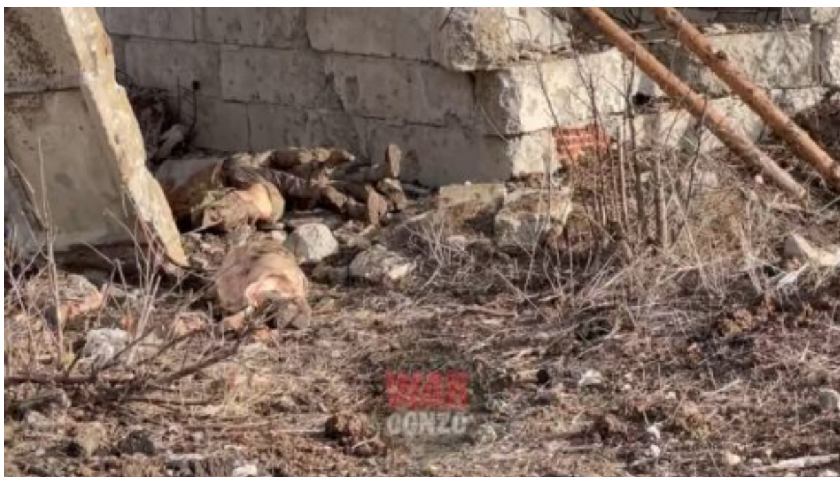
zabil ukrajinské vojáky

Zatímco Zelenskij obviňoval Putina z údajné vraždy Navalného a všichni MSM, američtí a evropští vůdci byli zaneprázdněni vyhrožováním Rusku odpovědí za údajné „zabití hlavního bojovníka za svobodu“, další tisíce ukrajinských mužů byly zraněny a zabity v kotli v Avdiivce.