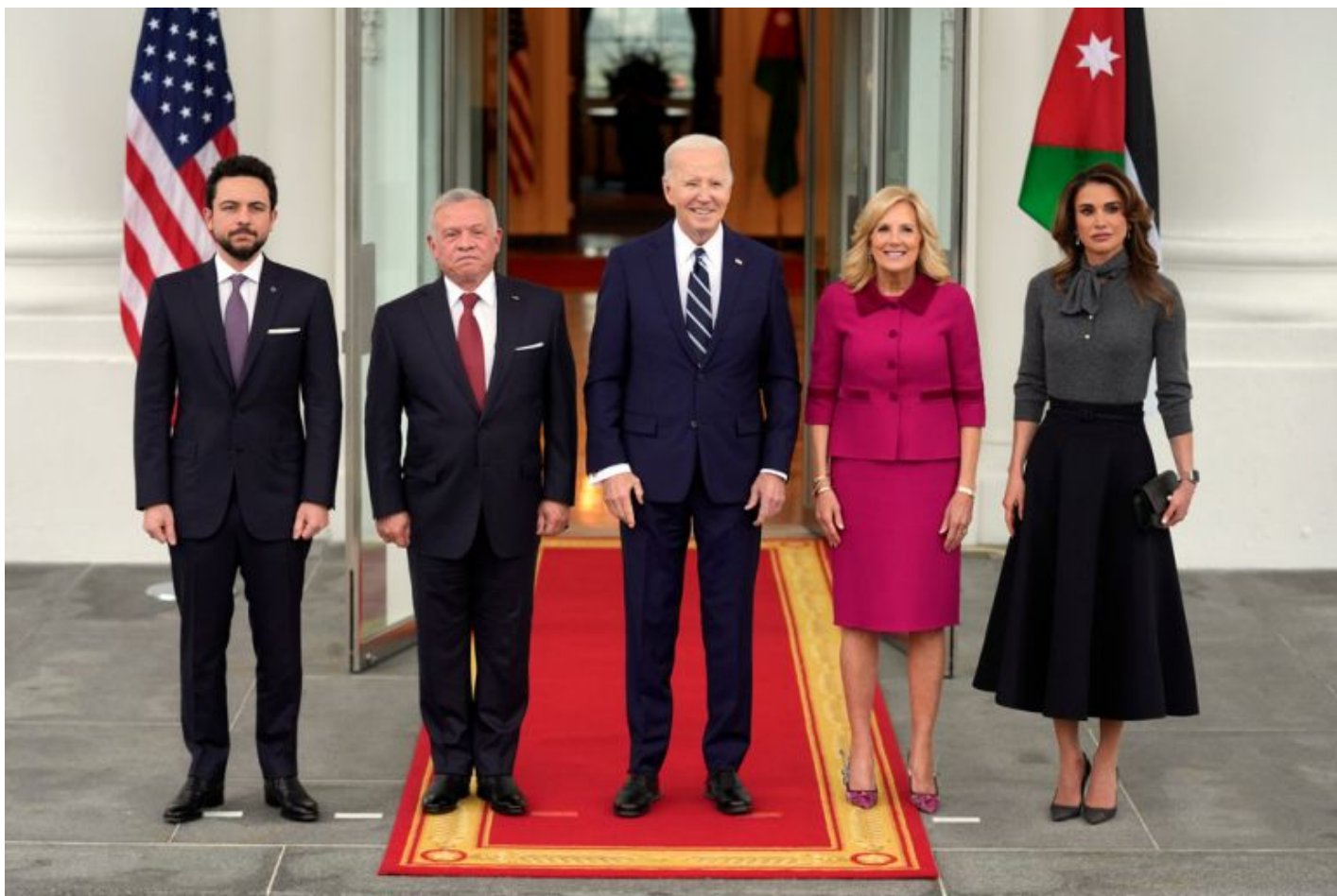
Prezident Joe Biden, třetí zleva, a první dáma Jill Biden, druhá zprava, pozdravují v Bílém domě 12. února jordánského krále Abdulláha II., druhý zleva, královnu Ranii, vpravo a korunního prince Husseina, vlevo