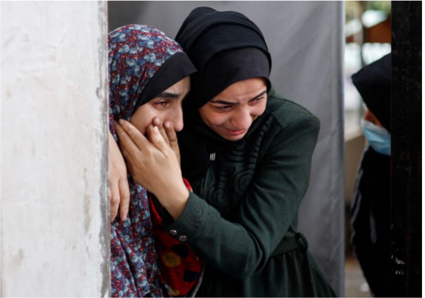
Mourners react at Abu Yousef al-Najjar hospital in Rafah following the death of Palestinians in Israeli attacks on the city, February 12, 2024