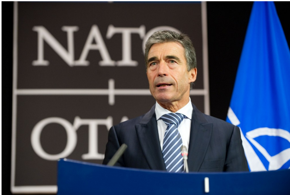
Anders Rasmussen, bývalý generální tajemník NATO

AFU obsadila dvě vesničky, Rabotino v Záprožji a Krynki na levém břehu Dněpru. Rusové v neděli vstoupili do jižní části Rabotina [3] a Ukrajince vytlačují, a Krynki byly znovu obsazeny Rusy již před 10 dny. Ukrajincům po té ofenzivě už nezůstaly v rukách ani tyto dvě symbolické vesničky. Je to naprostý kolaps a v Paříži v pondělí se proto jedná o změně pomoci, jak uvedl Robert Fico. A ta změna je logická, nezbytná a jediná myslitelná – bez přímé pomoci vojsk NATO prostě Ukrajina padne. To je realita a Robert Fico byl proto zděšen, co v tom utajeném dokumentu četl, protože je jasné, že na řadě je vyslání kontingentů vojsk ochotných zemí NATO.