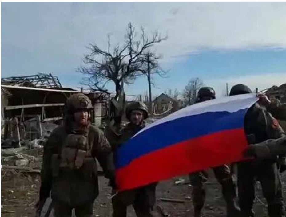
Ruská armáda postupuje z Avdějevky a obsadila další vesnici – Lastočkino

V této situaci je třeba stav analyzovat tak, že Ukrajinec v této chvíli nechýbí jen zbraně, munice a peníze na výplaty vojákům, kteří na frontě bojují za peníze, nikoliv zadarmo pro vlast. To je třeba brát na zřetel, že se jedná o placenou mobilizaci. Protože ten problém spočívá v této chvíli už někde jinde, že AFU nemá vojenský personál ochotný k boji. Kdo chtěl z Ukrajinců bojovat, ten za ty dva roky války již dávno padl, anebo je na frontě dosud, anebo je zmrzačený a doma jako válečný invalida. Všichni ostatní na Ukrajině jsou odmítači války a když budou i nakrásně mobilizováni násilně a proti své vůli, jejich bojová hodnota bude nula nula nic na bojišti.