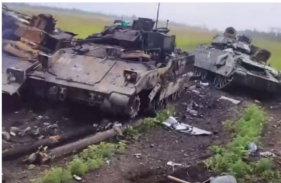
Americké obrněné vozy Bradley nedaleko Rabotina zničené na Surovikinově linii

Až dosud se zdálo, že s tím není problém, ale tato rovnice začíná prskat, protože Ukrajinci už dál nechtějí umírat ve válce, o které už vědí, že ji nemohou vyhrát. Takže ani případné nové peníze z USA a nové zbraně z USA již nebudou stačit, protože bude chybět to hlavní, totiž ochotný ukrajinský voják, který s těmi zbraněmi bude chtít bojovat. S touto alternativou se přitom nepočítalo. Uvnitř NATO se očekávalo, že AFU dosáhne nějakých výsledků během ofenzívy, třeba jenom 50% výsledků, což ale vadit nebude, protože pomalejší vítězení na frontě je pořád akceptovatelné vítězení pro pokračování válečného úsilí a pro udržení morálky obyvatelstva.