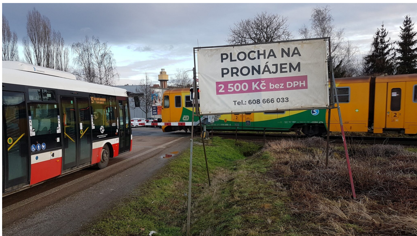
Billboard Eurobillboardu zakrývá světelnou signalizaci u železničního přejezdu a výhled na trať | Drnovská ulice | Praha | 19. únor 2022 | foto Kverulnat.org

Pronajímání billboardů nikdy nebyl byznys pro hodné hochy. Hodně billboardů je postaveno na černo nebo jim již dávno vypršelo povolení a jsou nelegální. Dva z billboardářů se ovšem svými kriminálními praktikami vymykají poměrům běžným v české kotlině. Jsou jimi v Čechách naturalizovaný Slovák Anton Fischer, kterému soud uložil podmínku a zákaz podnikání a jeho syn Oliver, kteří vystupují pod značkou Eurobillboard. Kverulantovým cílem je parazity z Eurobillboardu zastavit, a proto v prosinci 2022 vyhlásil bojkot* na jejich billboardy a vyzývá všechny případné inzerenty, aby se k tomuto bojkotu přidali. Výzvu k bojkotu Kverulant propaguje na Google a Seznamu placenou inzercí. Že je tento bojkot účinný dokazuje výhružný dopis od Eurobillboardu. Piše se v něm, že pokud Kverulant svůj bojkot nestáhne, bude čelit ze strany Eurobillboardu trestnímu oznámení a žalobě o náhradu škody. Ani tentokrát se Kverulant vyhrožování nezalekne. Bojkot nestáhne a bude jej dál propagovat. Prosíme pomozte nám odolat tomuto nátlaku a pokračovat v propagaci bojkotu alespoň symbolickým darem.