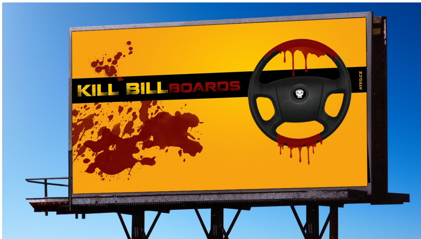
Fotokoláž pro Kverulatn.org ATEO

Podle novely č. 184/2023 Sb. se od 1. 1. 2024 přenáší povinnost zaobírat se nezákonně umístěnými reklamními plochami z tzv. silničních správních úřadů na vlastníky pozemní komunikace, tedy podle charakteru dané komunikace buď na stát, kraj nebo obec. Z nového znění § 31 vyplývá, že v případě výskytu nelegálního reklamního zařízení u pozemní komunikace je její vlastník této pozemní komunikace bez dalšího povinen konat a nezákonně umístěnou reklamní plochu odstranit a uskladnit, to vše na náklady vlastníka reklamní plochy. Teprve následně dojde k jeho vyzvednutí o možnosti si své reklamní zařízení do tří měsíců vyzvednout. Odst. 11 zároveň nově stanoví, že vyzvednutí uskladněné reklamní plochy či jejího nosiče je možné až po uhrazení veškerých nákladů na jeho odstranění a uskladnění vlastníkem pozemní komunikace. Nedojde-li k vyzvednutí do tří měsíců od zveřejnění takovéto výzvy k vyzvednutí, je vlastník pozemní komunikace oprávněn, opět na náklady vlastníka, reklamní zařízení zlikvidovat. Stejná práva a povinnosti, jako pro vlastníky pozemních komunikací, platí i pro jejich případné provozovatele, jsou-li odlišní od osoby vlastníka. To může být zásadní nejen pro servisní organizace zřízené vlastníky pozemních komunikací, ale i např. v rámci projektů PPP (Public Private Partnership).