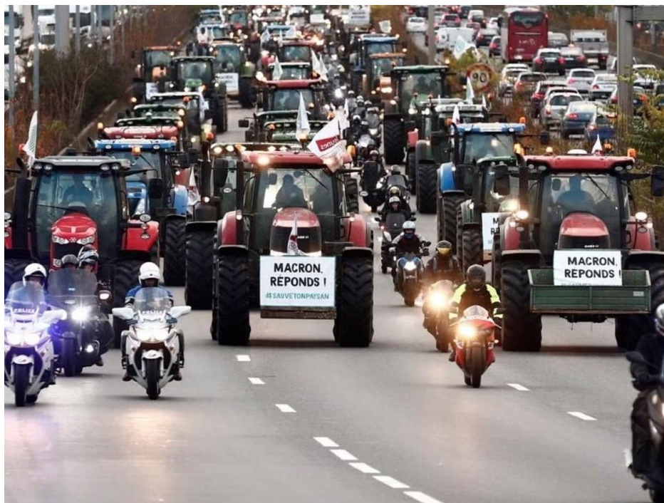
Farmáři zablokovali příjezdové silnice do Paříže

Jeich poselství je jasné: V důsledku levného dovozu, nedostatku dotací a zvýšených výrobních nákladů v důsledku vysokých cen energií, paliv, vysoké inflace a emisních povolenek se již nemohou užívat. Francouzský premiér Gabriel Attal totiž ve čtvrtek oznámil řadu ústupků, včetně dohody o nedovážení zemědělských produktů, které používají pesticidy zakázané v EU, tedy myšleno z Ukrajiny, a také nových finančních dotací a daňových úlev. Nová politika – prozatím – uklidnila dva největší francouzské zemědělské svazy, Mladé zemědělce a FNSEA (francouzská zkratka pro Národní federaci zemědělských svazů).