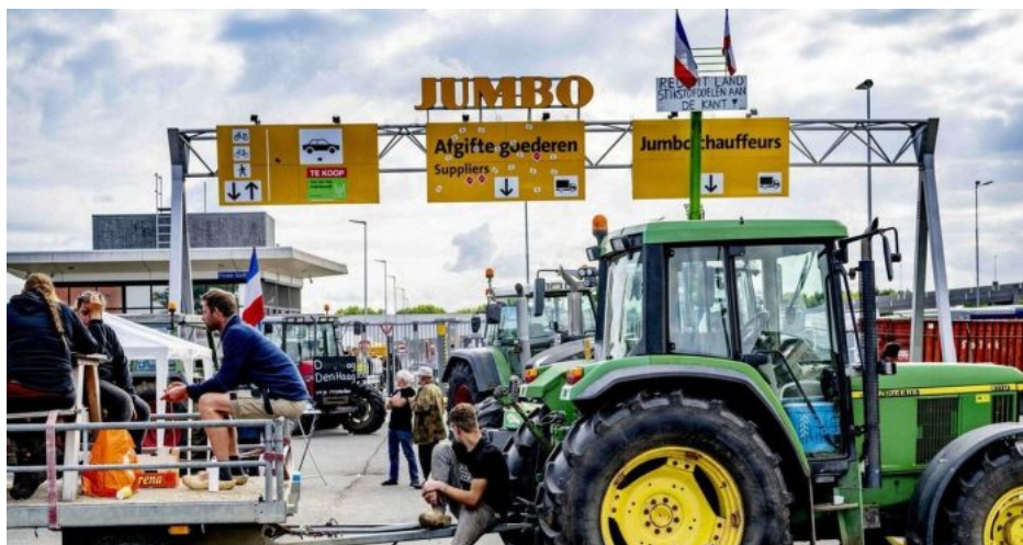
Protesty farmářů v Holandsku vedly vloni k pádu minulé vlády a k vzestupu Geerta Wilderse

Globalisté proto mají jiný paralelní plán na dosažení téhož, a to je vstup Ukrajiny a jejího zemědělství do EU. Vstup Ukrajiny položí zemědělce v celé EU, o tom nikdo nepochybuje. Zemědělci v EU zkrachují a globalisté skrze své korporace jako je BlackRock ovládnou za hubičku ukrajinské zemědělství, skoupi veškerou půdu na Ukrajině a tím ovládnou distribuci potravin do celé EU.