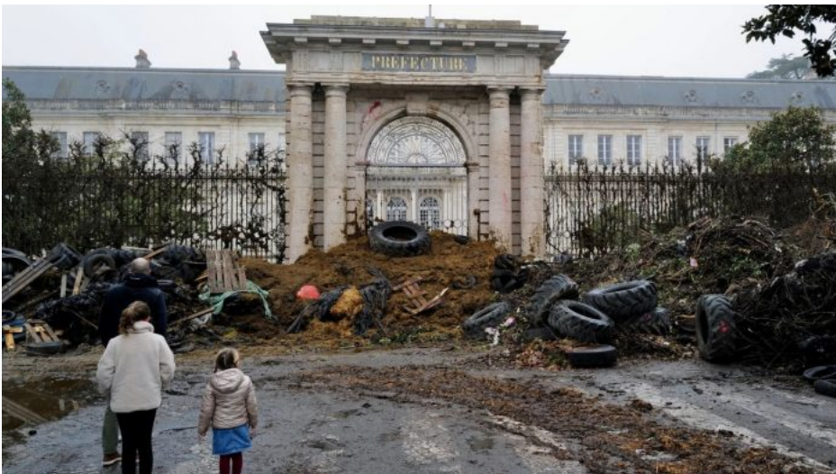
Francouzští zemědělci navezli hnuj a pneumatiky před pařížskou prefekturu

Problém je totiž v likvidaci tzv. podpůrných subvenčních titulů a především v daňových úlevách, které najednou skončily a k tomu Evropská unie začala zavádět program tzv. emisních povolenek i na zemědělce, což jsou v podstatě uhlíkové a dusíkové daně.