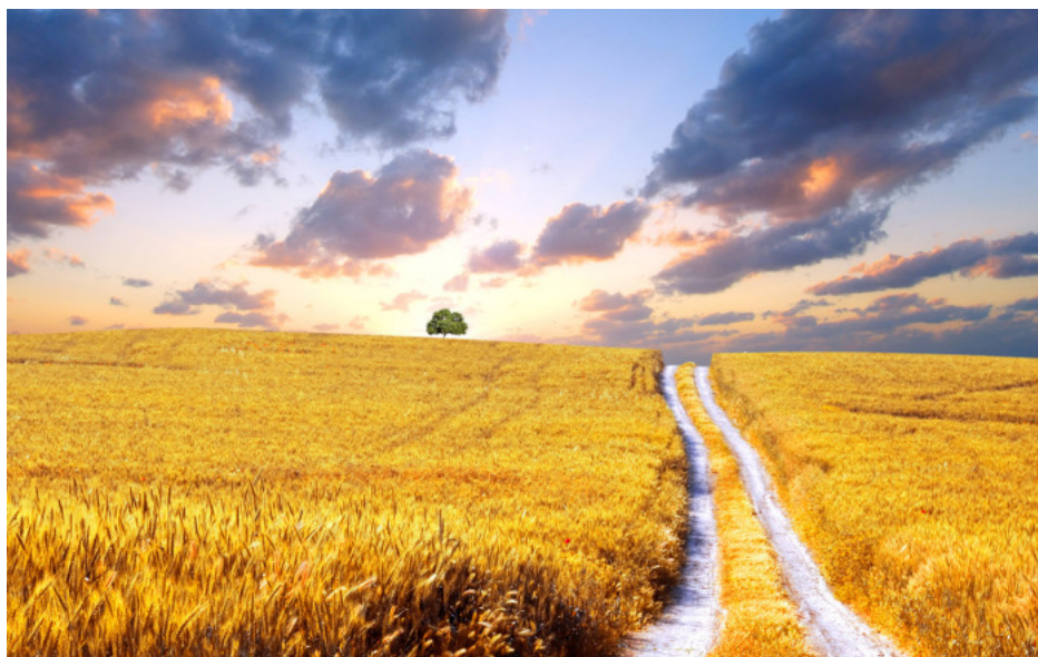
Ukrajinská půda v rukách globálních korporací bude šachovou koncovkou na likvidaci zemědělství v Evropě

To samo o sobě ukazuje, že globalisté mají odpor jen v malé části evropské populace a brzy se dá očekávat, že ve Francii i v Belgii přijdou další omezení na zemědělce, a to ve chvíli, kdy bude zajištěno převzetí kontroly nad ukrajinskou agrární výrobou. Nestačí totiž jen zlikvidovat evropské zemědělce, je potřeba zajistit kontrolu globalistů nad manažovanou distribucí potravin. A tuto distribuci oni zatím nekontrolují, nemohou prostě odštípnout francouzské zemědělce a nahradit jejich produkci nějakou jinou, která se bude skládat z části z klasických a z části z udržitelných potravin nového věku a zavedení Total Control systému na distribuci a dostupnost potravin.