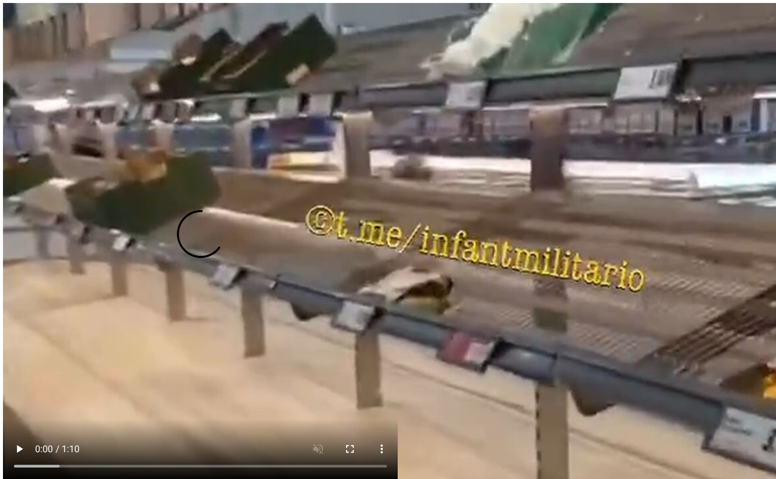
Supermarkety v Paříži mají kvůli stávce farmářů prázdné regály s potravinami!

Protesty farmářů v Evropě mají hluboký původ a není to problém posledních několika měsíců. Přesně před 20 lety vstoupila ČR do EU, a to 1. května 2004. Málokdo si však dnes již vzpomene, co zásadního se před 20 lety odehrálo v Evropské komisi. Němečtí, francouzští, belgičtí a holanďtí farmáři si tehdy pomocí lobbyingu u svých politiků vynutili podmínku poskytování dotací svým zemědělcům na kompenzování vlivu levného zemědělství nově přistupujících zemí do EU, především vliv Polska.