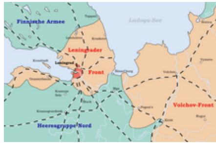
Situácia od mája 1942 do januára 1943.