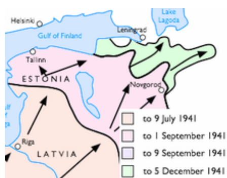
Prehľad oblastí bojov v okolí Leningradu

Leningrad bolo ako druhé najväčšie sovietske mesto a najväčší prístav v celej krajine, dôležité priemyselné a komunikačné centrum a zároveň základňa Červenej Baltskej flotily hneď od počiatku bojov medzi Treťou ríšou a ZSSR jedným z najdôležitejších cieľov nemeckých útokov. V meste sa vyrábala oceľ, lokomotívy, tanky KV, nachádzal sa tam taktiež najväčší gumárenský závod v Európe. S jeho dobytím počítali najelementárnejšie plány operácie Barbarossa.