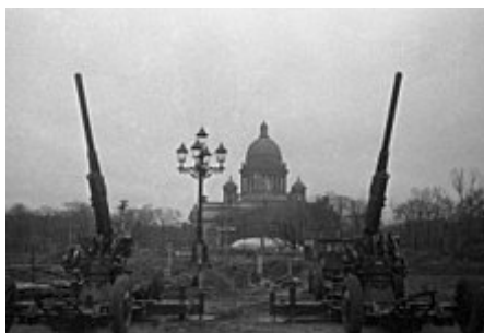
Postavenia protiletadlovej obrany v centre mesta, v pozadí Isaakijevskij chrám.

Začiatkom augusta Nemci prelomili postavenia 8. armády a rozdelili na ju dve skupiny, 10. strelecký zbor zostal odrezaný v Estónsku a pokúšal sa dostať do Tallinnu, 11. zbor ustupoval k Narve. 19. augusta Nemci obsadili Novgorod a 20. Čudovo. Od 22. augusta do 7. septembra sa rozhoreli boje v oranienbaumskom smere. 30. augusta 1941 sa pri Mge podarilo nemeckým vojskám preťať železničnú trať smerom na Moskvu a prerušiť tak železničné spojenie Leningradu s okolitým svetom, situácia v meste bola nanajvýš vážna. Rozhoreli sa týždeň trvajúce boje o Krasnogvardejsk. V tejto dobe prebehli organizačné zmeny sovietskeho velenia obrany mesta. 23. augusta bol rozdelený Severný front na Karelský (gen. V.A. Frolov) a Leningradský (gen. M.M. Popov, neskôr od 5. septembra K.J. Vorošilov). 29. augusta bolo velenie Severozápadného frontu spojené s Leningradským frontom a podriadené priamo Štábu hlavného velenia.