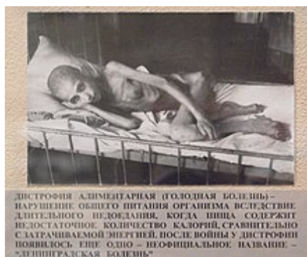
Vyhladované leningradské dieťa v nemocnici.

V dôsledku toho, že nemecké sily neboli schopné obsadiť mesto z chodu, začali ho od 26. septembra 1941 obliehať, ostreľovať ťažkým delostrelectvom a intenzívne bombardovať. V jednom z nemeckých rozkazov sa zachovalo svedectvo o tom, že v prípade dobytia mesta nacistickými vojskami si Hitler jeho ďalšiu existenciu neprial a neváhal ho preto zrovnať so zemou. Situácia v meste sa zatiaľ stávala čoraz viac kritickou zo sanitárneho hľadiska. Do mesta pred postupujúcimi Nemcami totiž utekalo veľa civilistov zo širšieho okolia. Mesto však na taký veľký príliv utečencov nebolo pripravené a väčšina z nich žila v provizórnych utečeneckých táboroch. Po tom čo sa začala zima boli práve oni jednými z prvých, ktorí začali umierať v dôsledku hladu. Zlú situáciu obkľúčeného mesta navyše umocnilo zničenie Badajevových skladov potravín pri nemeckých náletoch 8. septembra. Až 12. septembra sa ukázalo, že v meste zostali zásoby pre armádu a civilistov aj v prípade veľmi ekonomického zaobchádzania len na niekoľko týždňov. Odhady vyčíslili ich stav takto [7] :