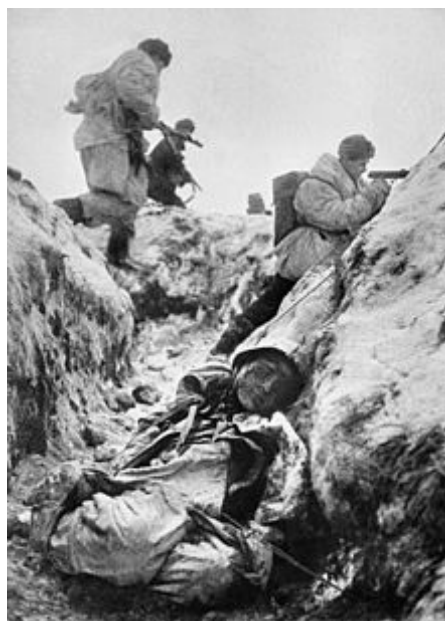
Útok sovietskej pechoty na nemecké postavenia pri Leningrade, december 1943.

Od polovice do konca januára roku 1943 sovietske vojská Leningradského a Volchovského frontu uskutočnili oslobodzovaciu operáciu Iskra, jej výsledkom bolo získanie 10 až 15 km širokého koridoru južne od Ladožského jazera, kadiaľ bolo obnovené pozemné spojenie so zvyškom ZSSR. Cesta ako aj celé mesto však zostali aj naďalej v dostrele nemeckého delostrelectva. Až 15. januára 1944 začali sovietske jednotky rozsiahlejšiu útočnú operáciu, ktorá mala zahnať nacistov ďalej od mesta. Nemecká obrana však bola v tejto oblasti dobre opevnená, opierala sa o najsevernejšiu časť nemeckého východného valu. Vzhľadom na to, že front sa na tomto úseku príliš nepohyboval už asi dva roky, mali nemecké jednotky veľa času na to, aby vybudovali skutočne silné obranné pozície. Za prvý deň bojov sa cez tieto postavenia podarilo postúpiť sovietskym streleckým jednotkám iba približne o 3500 metrov. [10] Nemecké jednotky však boli pod veľkým tlakom nútené ustupovať. 26. januára 1944 bolo bezpečné spojenie medzi Leningradom a Moskvou obnovené. 900-dňová blokáda mesta, ktorá si vyžiadala státisíce ľudských životov sa skončila. Onedlho po tom čo boli nasadené čerstvé posily prenikli sovietske vojská k Fínskemu zálivu, Il'menskému jazeru a postupovali ďalej cez Karéliu do Fínska, kde sa zastavili v lete 1944 pri Viipurskom zálive a rieke Vuoksi, čím prinútili Fínsko rokovať o mieri.