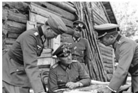
Veliteľ nemeckej 4. tankovej skupiny E. Höpner na porade s dôstojníkmi.

Počiatková fáza nemeckého útoku smerom na Leningrad a Archangelsk sa vyvíjala pre Wehrmacht veľmi sľubne, najmä vďaka nasadeniu tankových divízií a kvalitnej cestnej sieti Pobaltských republík, ako aj pre Leningrad veľmi blízkom fronte na Karelskej šiji. Nemecký postup na tomto úseku frontu bol závislý najmä od rýchleho obsadenia mostov cez Dvinu pri Dvinsku (dnes Daugavpils), ktoré sa nachádzali 350 km za hranicami. Ich rýchly postup (mosty pri Dvinsku boli obsadené už 4. deň bojov) bol natoľko nebezpečný, že 27. júna 1941 vydal miestny Soviet v Leningrade rozkaz na vytvorenie jednotiek domobrany a opevnenie mesta. V priebehu niekoľkých dní boli vytvorené tri divízie domobrany, tvorené dobrovoľníkmi. Po nedostatočnom výcviku a bez potrebných skúseností a výzbroje boli tieto divízie vrhnuté na front, ktorý zúfalo žiadal akékoľvek zálohy. Medzitým boli urýchlene budované obranné línie na Neve, Luge v oblasti Petergofu, Čudova, Uritska, Krasnogvardejska (dnes Gatčiny), Pulkova ako aj zo severu smerom od neďalekých hraníc s Fínskom. Pri tom boli čiastočne využité zvyšky opevnení Stalinovej línie. Navyše bolo za pomoci civilného obyvateľstva vybudovaných 190 km drevených zátarás, 635 km protipechotných zátarás z ostnatého drôtu, 700 km protitankových priekop, 5000 drevozemných a železobetónových bunkrov a 25 000 km zákopov. Tieto obranné línie vo veľkej miere podporovalo delostrelectvo baltskej flotily, ktorá bola v konečnom dôsledku uväznená v meste.