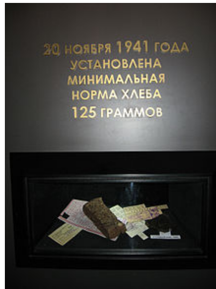
20. 11. 1941 - Ustanovená minimálna norma chleba na deň - 125 g.