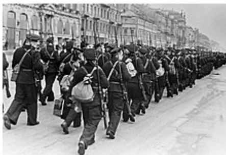
Sovietski námorníci baltskej flotily v úlohe námornej pechoty pri odchode na front.

Keď boli zvyšky XXXIX. tankového zboru 22. decembra 1941 pri údajných -52\text{ }^{\circ}\text{C} presunuté cez Volchov, mali za sebou urputné ozbrojené stretnutia s nepriateľom. Iba samotná sliezka 18. pešia (motorizovaná) divízia stratila 9 000 mužov a jej mužstvo teraz predstavovalo 741 mužov. Veľké straty mali aj ostatné nemecké jednotky, 3. prápor 30. pechotného (motorizovaného) pluku pri pochode z Čudova do Tichvinu stratil v dôsledku silného mrazu -40\text{ }^{\circ}\text{C} a s ním súvisiacich omrzlín 250 mužov, čo bola prakticky polovica jeho bojovej sily. Aj napriek tomu, že boje na čas ustali sa úsek frontu medzi Leningradom a Volchovom stal trvalým ohniskom nebezpečenstva pre nemecké vojská pred Leningradom.