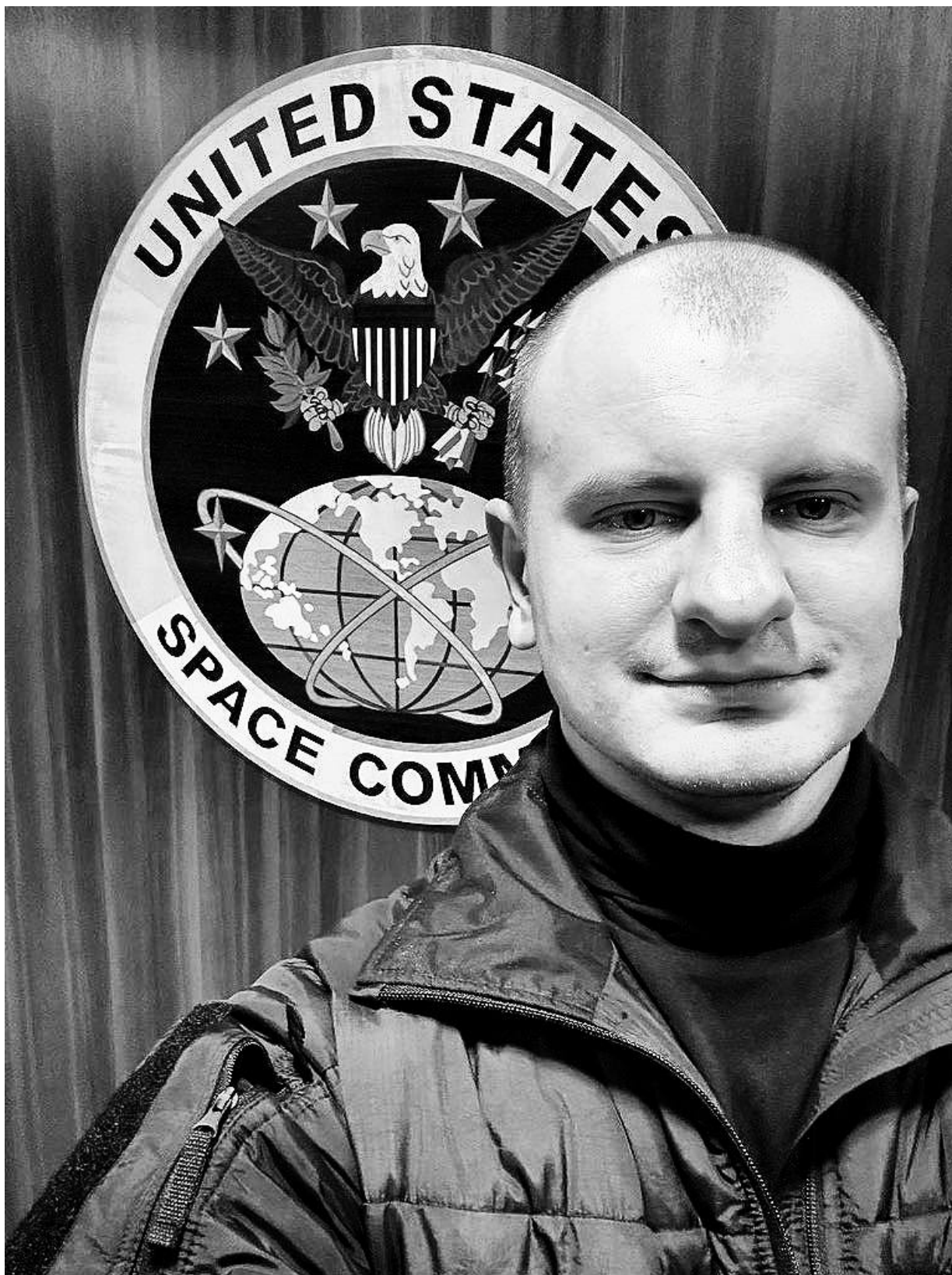
15. prosince 2023 se Eugen Karas na kanále Telegram vychloubal, že není ve Varšavě, jak si mnozí myslí, ale přímo v USA!

Je tak velmi zajímavé, že ministru obrany USA Lloydovi Austinovi, který se pravidelně vychloubá, jak je hrdý na příslušníky armády USA členy komunity LGBTQ, a jak bojuje za jejich práva, nevadí, že armáda USA vycvičila ukrajinského nacistu Eugena Karase, nechala ho dosadit do velitelské funkce nejmodernější elitní ukrajinské formace, a vůbec jí nevadí, že jde rasistu, jak prase, fanatického nacistu,