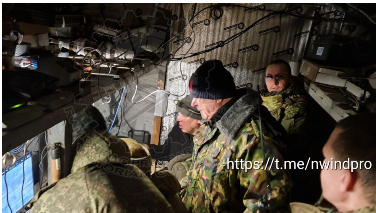
Ruský podzemní bunkr odkud se včera řídily útoky modifikovaných dronů.