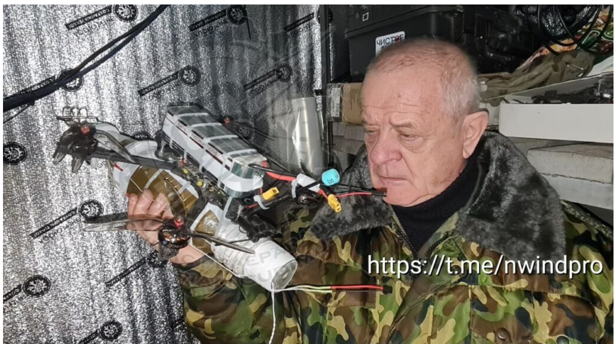
Detail práce ruských operátorů navádějících včera modifikovaný dron na cíl.