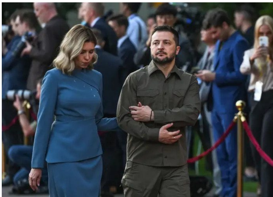
Zelenský se svojí manželkou, která se mu stará o majetkové portfolio

Ukrajinci nejsou všichni náckové, ani Banderovci, jsou to normální lidé, kteří válku nechtěli, proti Rusku jít bojovat nechtěli, mnozí ani Majdan nepodporovali, ale teď by měli jít umírat za Ňuchačenko a jeho krasavici, na kterou má napsané nemovitosti po celém světě? Tak se prostě seberou a jdou. Ti, kteří mají peníze, uplatí celníky na hranici a skončí v EU. Ti, kteří nemají peníze na uplacení, zmizí v podsvětí na Ukrajině mimo systém.