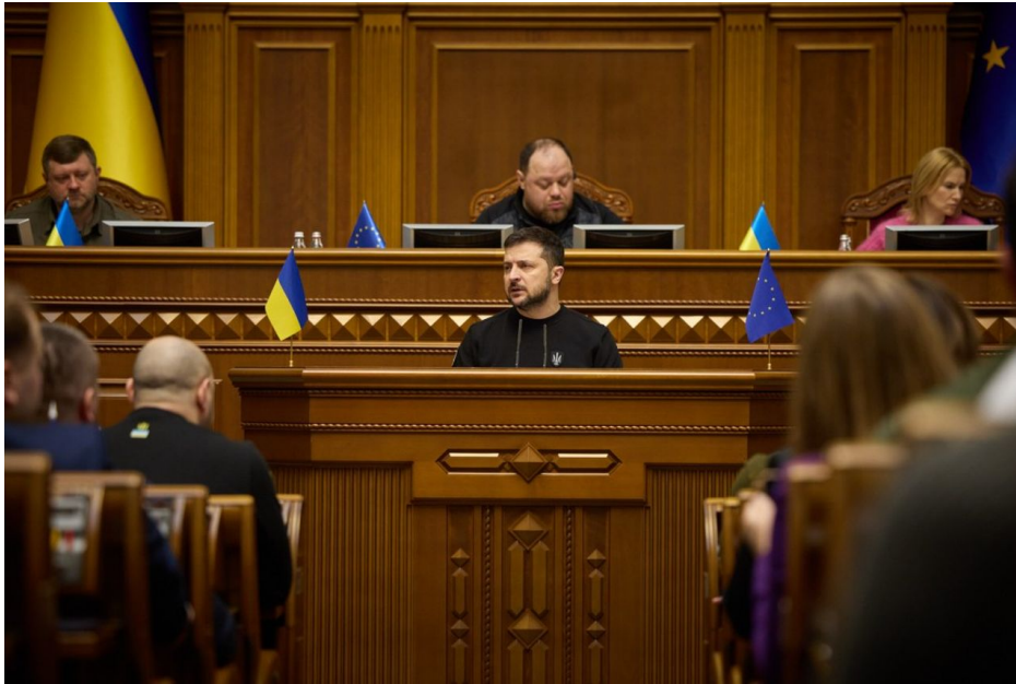
Volodymyr Zelenskyy má v ukrajinském parlamentu den ode dne slabší pozici

Ukrajina je obrovská země a tito lidé prostě se najednou ztratili, aniž by opustili území Ukrajiny. Ti lidé rovněž přestali chodit do obchodů na nákupy, ve kterých patrolují hlídky odvodních úřadů (TCC), protože na Ukrajině se po éře Covidu rozšířili donáškové služby, takže tito lidé si objednávají zboží na donášku, od jídla až po oblečení, drogerii, léky, prostě úplně všechno. Tyto služby přitom rovněž poskytují donáškové firmy, které fungují buď napůl anebo úplně mimo systém. Na ruských sociálních sítích si z toho dělají legraci, že se Putinovi povedli demobilizovat 3,4 milionu Ukrajinců bez jediného výstřelu, což je ale do značné míry nesprávné vyhodnocení.