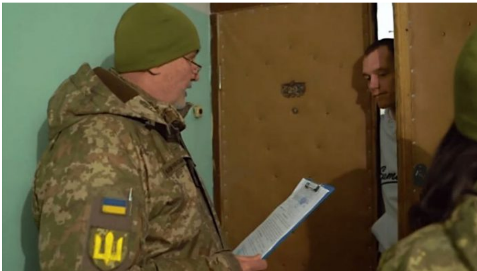
Odvodní komisař TCC u dveří muže povoláného k mobilizaci

Všichni Ukrajinci, kteří chtěli dobrovolně bojovat za Ukrajinu, už odvedeni byli a buď jsou mrtví, anebo invalidní po zmrzačení v boji. V této chvíli už na Ukrajině není ani jeden jediný Ukrajinec, který by v současné chvíli chtěl jít na frontu dobrovolně. A proto přišel prezident Zelenskyy minulý rok v prosinci s návrhem novely mobilizačního zákona, který po pár dnech nakonec z parlamentu stáhl kvůli přepracování, protože neměl šanci na schválení.