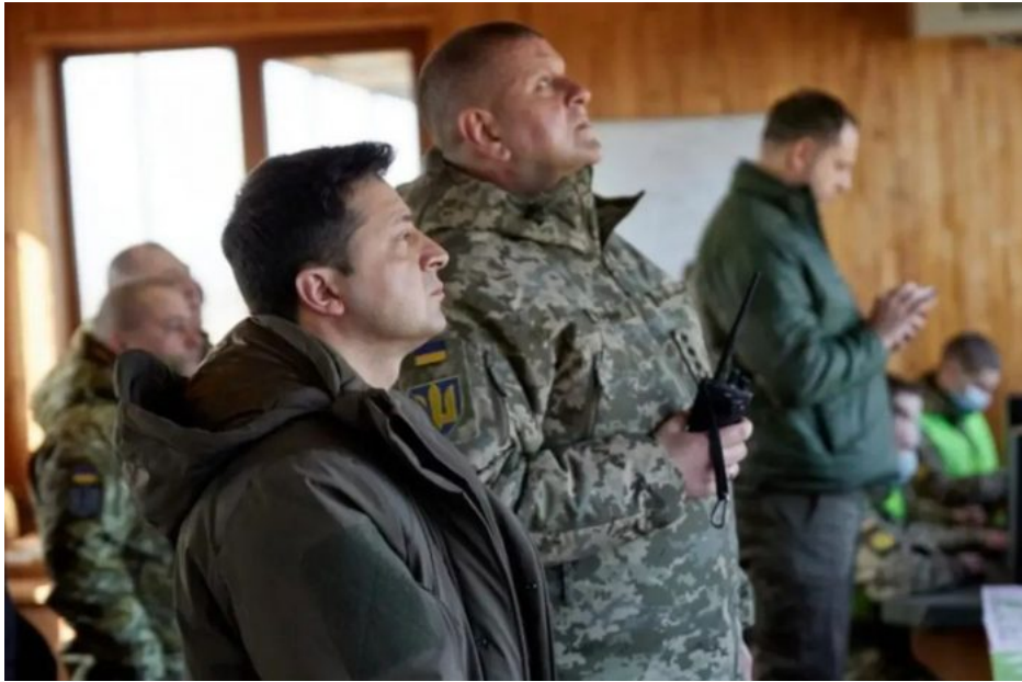
Volodymyr Zelenskyy a Valerij Zalužný na štábu ve frontovém týlu

Jenže, protože za Zalužného podle všeho nemá náhradu, a zřejmě žádného dalšího blázna, který by chtěl velet poražené armádě, s největší pravděpodobností nenajde, tak nakonec je z toho blamáž a Zalužný musí v demisi dál řídit armádu, i když už teď nejen on, ale celý genštáb a všichni ukrajinští vojáci už vědí, že Zalužný nemá podporu Zelenského, že končí ve funkci a nikdo jiný za Zalužného není. Nejen Aeronet, ale už i americký list The Washington Post to má za hotovou věc, že Zalužný fakt končí [2] a není to hoax. Vžijte se do situace ukrajinského vojáka, který teď vidí, jak se v Kyjevě požírají mezi sebou předáci Ňuchačenkova režimu se špičkami armády. Zelenského se tak možná pokusí odstranit jako Adolfa Hitlera v létě roku 1944 ve Vlčím doupěti.