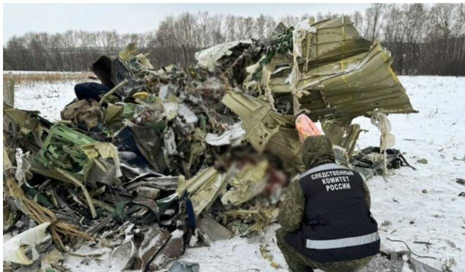
Trosky sestřeleného IL-76 u Belgorodu

Sluckij asi právě přiletěl z dovolené z Marsu, že si nevšiml, že celá americká politika Deep State v kongresu je ovládána nacisty a apelování na nacisty, to snad nemůže myslet vážně. Číňan má Rusy v paži a zkouší Ukrajincům vozit uniformy pomocí ruských drah a ruští poslanci chtějí apelovat na americké kongresmany? Začínám rozumět nasraným Rusům den ode dne více, protože zatímco ruští vojáci umírají, tak ruská média chrání dobré jméno Číny překrucováním informací o dodávce ukrajinských uniforem přes ruské železnice bláboly o tranzitu přes Čínu a дума má strach pojmenovat, kdo stojí u ovládacích aparatur PVO komplexů Patriotů v Boryspilu, která sestřelil ruský IL-76 nedaleko Belgorodu.