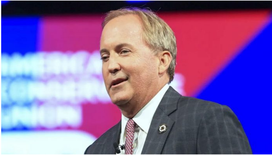
Ken Paxton, generální prokurátor Texasu

Když byly USA zakládány, jednotlivé státy si ponechaly své státní ústavy a v nich právo na obranu státu a vnitřních hranic. Byla to pojistka pro případ, že by se unie buď rozpadla, anebo by federální vláda přestala státy chránit, případně by tyto státy nějak ohrožovala. Tohle, co provádí poslední 4 roky Bidenova vláda, je globalistická rozborka USA. O tom není pochyb.