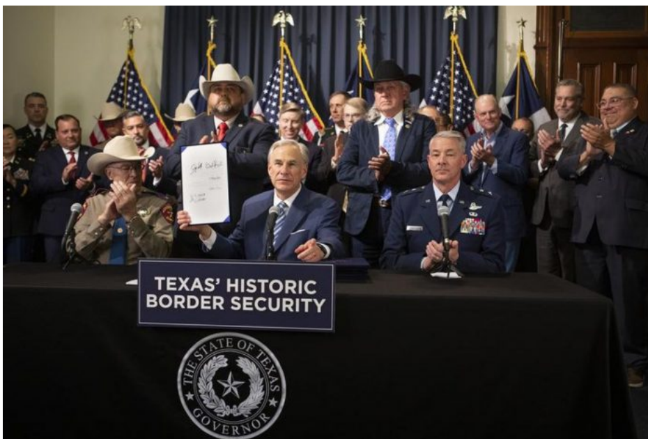
Guvernér Texasu Greg Abbott se zákonem nařizujícím blokádu hranic Texasu s Mexikem z důvodu ohrožení bezpečnosti a integrity státu Texas

Netrvalo to dlouho a předpověď bývalého ruského prezidenta Dmitrije Medveděva o rozpadu USA v roce 2024 se začíná pomalu naplňovat. Celé to začalo před několika dny v Texasu, když guvernér Greg Abbott odmítl uposlechnout rozsudek Nejvyššího soudu USA, aby nechal z hranic Texasu s Mexikem odstranit žiletkový plot a bariéry z kontejnerů, která tam nechal guvernér rozmístit na zastavení migrační vlny ze zemí Latinské Ameriky. Texasu došla trpělivost a osud USA visí na vlásku. Národní garda Texasu totiž na příkaz guvernéra koná v rozporu s rozsudkem Nejvyššího soudu USA s odkazem na ústavní zákon Texasu o vnitřní bezpečnosti, který je nadřazení federálním zákonům i federálním soudům.