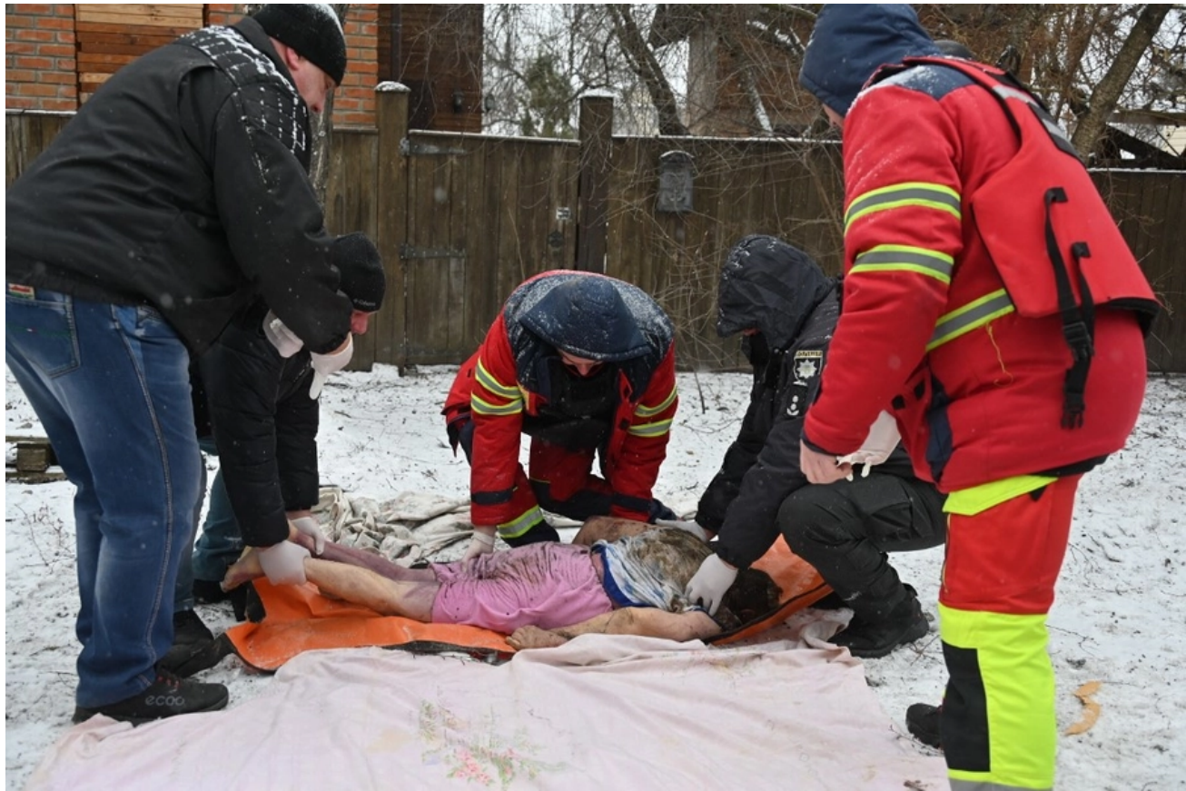
Záchranáři a policista nesou tělo oběti po ruských úderech ve Zmiiv, Charkovská oblast, 8. ledna.

Podle zveřejněných údajů AFU v útoku z 8. ledna převládaly pokročilé ruské raketové systémy, včetně čtyř balistických střel Kinzhal odpálených ze čtyř letounů MiG-31K ( označení NATO „Foxhound“), 24 řízených střel smíšených typů svržených 11 Tu-95MS (označení NATO „Medvěd“) strategické bombardéry; osm řízených střel Kh-22 svržených blíže nespecifikovaným číslem Tu-22M3 (označení NATO „Backfire“) námořními bombardéry; a šest balistických střel země-země Iskander-M.