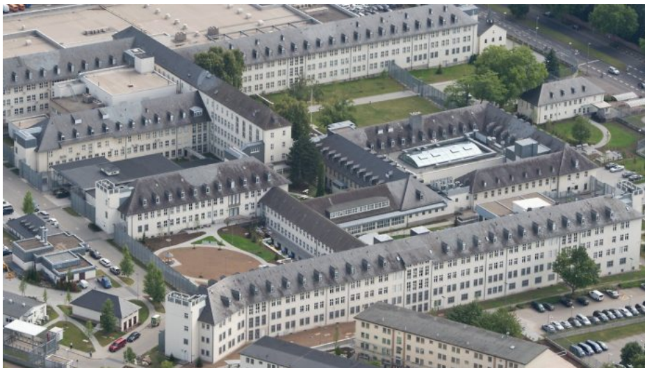
Pohled ze vzduchu na mamutí areál Generálního konzulátu USA ve Frankfurtu, kde je i sídlo Okupační správy americké armády v Německu

Obrovské navýšení daní z plynu a dodávek tepla ze 7% na 19% je důkazem, že Scholzova vláda je v takové krizi, že už nemá kde brát, a tak navyšuje daně z plynu a tepla skoro trojnásobně. Američanům se podařilo zlikvidovat německý ekonomický superkolos. A přitom Rusko sankce ani neškráblý. Rusko za poslední rok rostlo o 3,2% na HDP za minulý rok.