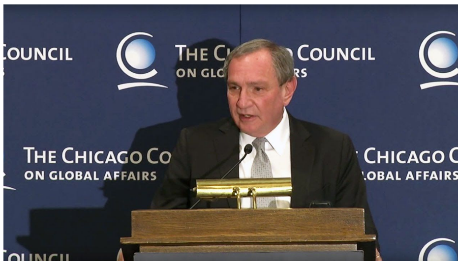
George Friedman, spisovatel a ředitel think-tanku Stratfor

Mluvil o tom znovu v únoru 2015 na konferenci [2] Chicago Council on Global Affairs legendární americký spisovatel a ředitel think-tanku Stratfor George Friedman v projevu s názvem “Evropa: Evropa předurčena ke konfliktu?” a právě v něm vysvětlil, proč se USA snaží zabránit konjunkci a sloučení Ruska a Německa , protože by to ohrozilo nejen americké zájmy v Evropě, ale doslova v celém světě, protože spojením ruské surovinové základny a supervýkonného německého průmyslu by vznikl světový ekonomický hegemon, který by převálcovoval jak USA, tak i celou a Američany ovládanou skupinu G7.