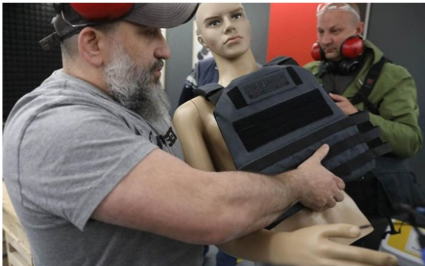
Z testu neprůstřelných vest

REPORTÁŽ Neprůstřelné vesty Star of Davidson jsou na profesionální úrovni a splňují i úroveň TBO-7CZ (třída balistické odolnosti). Certifikát verifikující tyto hodnoty vystavil Český úřad pro zkoušení zbraní a střeliva majiteli obchodní známky Star of Davidson.