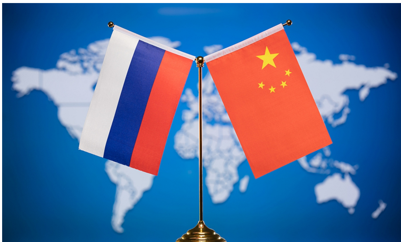
Čína Rusko