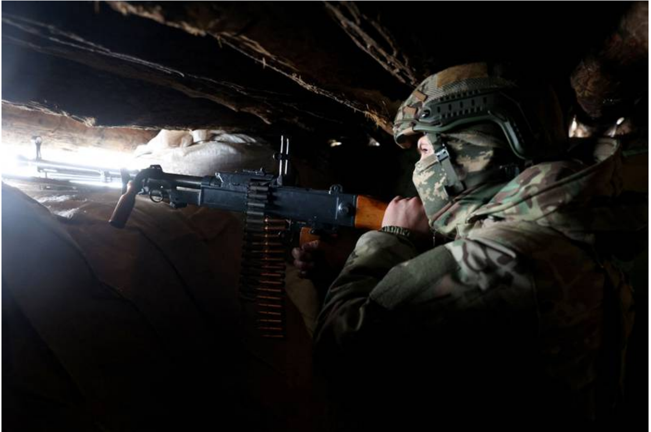
Ukrajinský voják na frontě poblíž Ruskem okupovaného města Horlivka v Doněcké oblasti.

"Takže v podstatě zmobilizovali své otce," řekl gen Barrons. „Ale jediný způsob, jak mohou prolomit patovou situaci, je mobilizace občanské společnosti. Musí zmobilizovat své mládí a najít více lidí ochotných bojovat.“