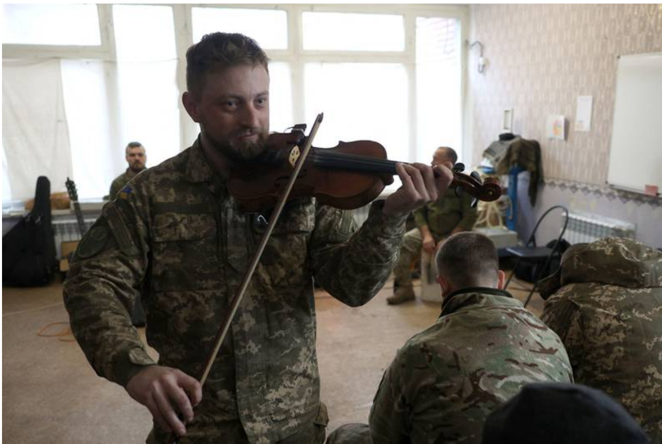
Hudebník Ukrajinských kulturních sil vystupuje pro vojáky v zotavovacím centru v Doněcké oblasti.

Teherán také pravděpodobně dodá Moskvě rakety dlouhého doletu, které jí poskytnou objem, aby mohla zasáhnout ukrajinskou infrastrukturu, zejména její dodávky elektřiny.