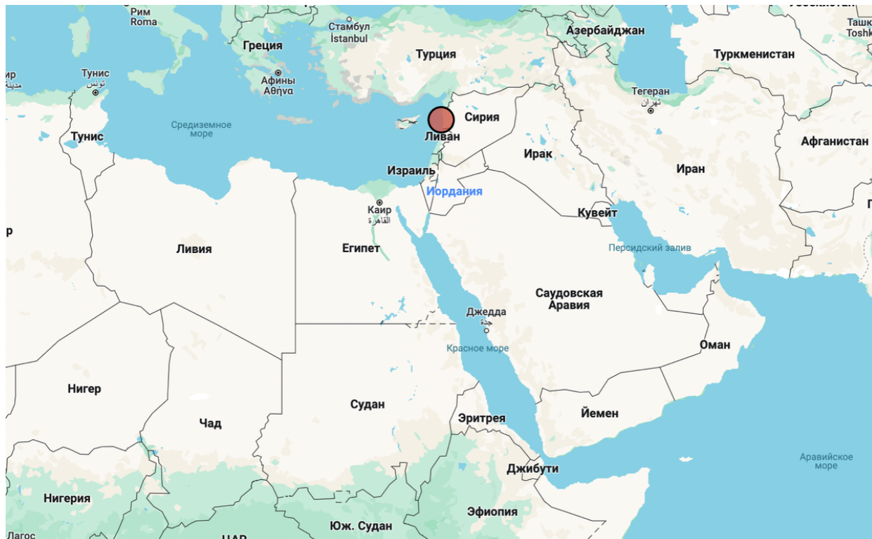
Зáкладна в Tartus (Сýрие).

zároveň zůstat „odemčená“ v Černém moři.