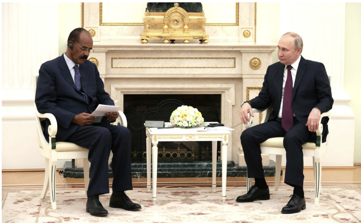
prezident Isaias Afwerki.

Tento stát je ale k Rusku velmi přátelský. V OSN vždy hlasuje pro naše rezoluce a proti rezolucím nepřítele. Prezident Eritreje odletěl na jaře do Moskvy a hovořil s Putinem.