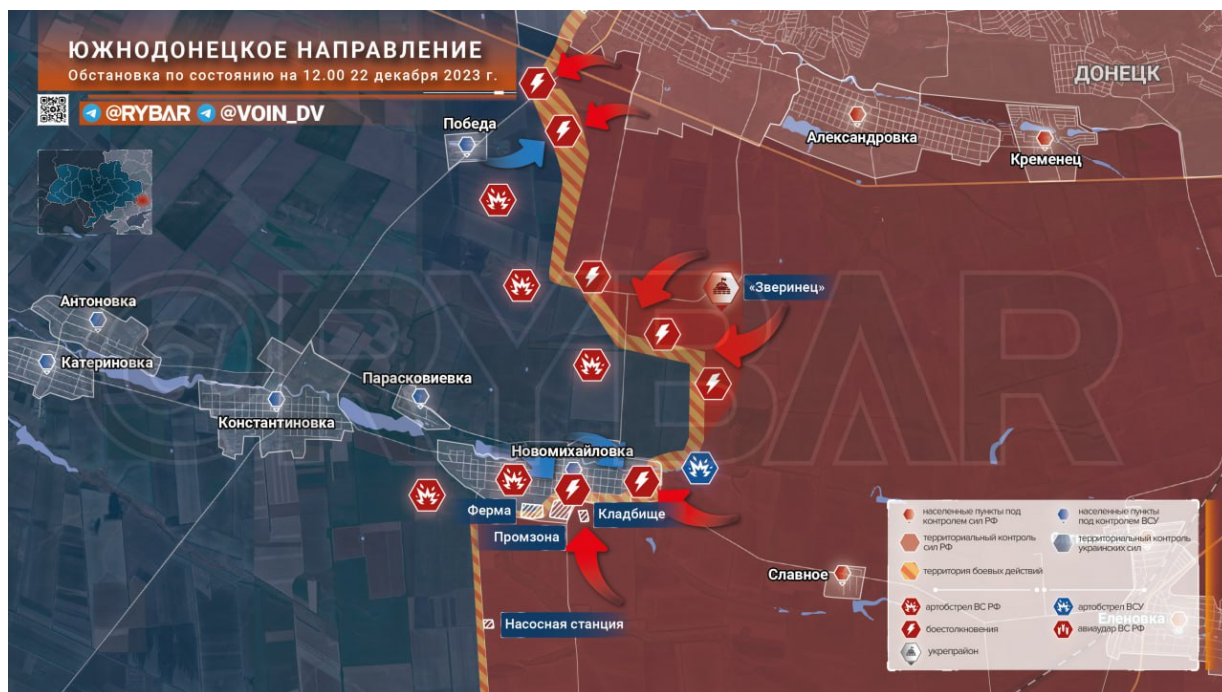
Mapa bojiště jižně Doněcka po dobytí největší ukrajinské pevnosti «Зверинец», která Rusům 600 dní bránila v postupu na Západ ke Dněpropetrovsku.

Včera se opět ukázalo, že válku na Ukrajině nemůže Západ nikdy vyhrát, dokud nevyžene zkorumpované kyjevské úředníky a politiky do zákopů na ruskou frontu. Vysoký úředník tamního režimu byl včera zadržen SBU, protože ve spolupráci s organizovanou zločineckou skupinou zbrojařů vytvořil korupční schéma a pomocí přemrštěných cen dělostřeleckých granátů nechal zmizet za jediný rok 36 milionů EUR = 900 milionů CZK! Jediný úředník tak dokázal ukrást 0.07% objemu veškeré pomoci EU Ukrajině za celý rok! Kolik takových úředníků v Kyjevě je? Ukrajinská armáda nyní nemá čím střílet, jak přiznali její generálové.