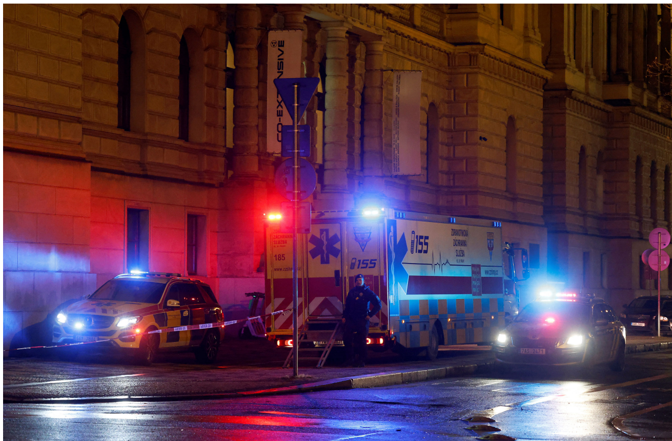
Policista stojí u sanitek zaparkovaných ve čtvrtěk poblíž areálu střelby na Univerzitě Karlově v Praze.

Všechny akce na Univerzitě Karlově v Praze byly ve čtvrtek a pátek zrušeny, protože po smrtící střelbě v jejím areálu začnou platit přísnější bezpečnostní opatření.