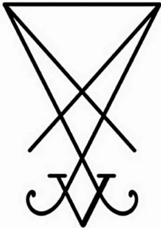
The Sigil of Lucifer