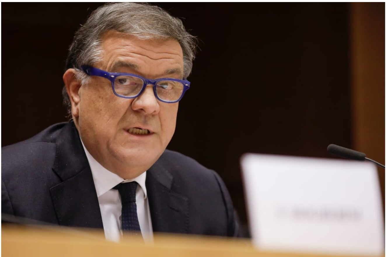
Pier Antonio Panzeri