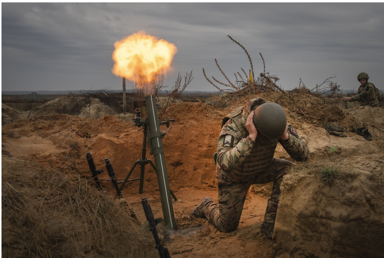
Vojáci ukrajinské Národní gardy 1. brigády Bureviy (Hurikán) cvičí během bojového výcviku na vojenském cvičišti na severu Ukrajiny, středa 8. listopadu 2023.

“Všichni jsou unavení a existují různé názory, bez ohledu na jejich postavení,” řekl Zelenskyj v reakci na komentáře na tiskové konferenci s předsedkyní Evropské komise Ursulou von der Leyenovou a dodal: “Ale není to patová situace.” Jeho zástupce šéfa kanceláře Ihor Žovkva řekl, že rozhovory o patové situaci „usnadňují agresorovi práci“ a způsobují „panika“ mezi ukrajinskými spojenci.