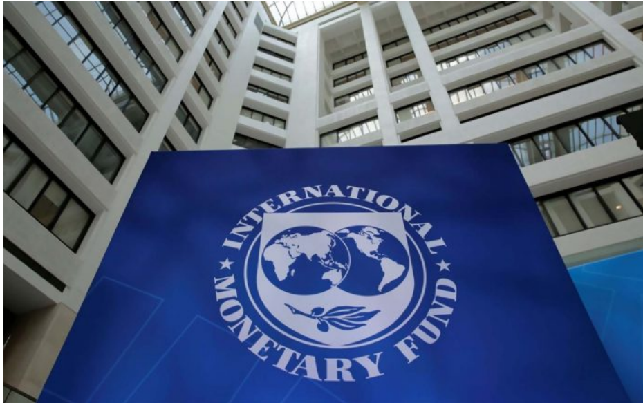
Dealer amerických úvěrových dluhopisů pro více než 200 zemí světa – Mezinárodní měnový fond

Aby totiž ten plán na záchranu západních ekonomik fungoval, musí jít o mamutí rekonstrukci v řádech bilionů dolarů, o ničem menším než o bilionech se ani v EU nemluví, a na takové investice je potřeba Ukrajinu ještě více rozbít. O tom není pochyb. Není proto divu, že Soskinovi a dalším Ukrajincům to již pomalu dochází, že něco tady opravdu nehraje. Ukrajina se skutečně stala prostředkem k záchraně ekonomik západních zemí, a protože čas běží a v EU i v USA se naplno rozjela recese, která plodí obrovskou inflaci, která je navíc urychlována odstřížením západních zemí od levných ruských energií a surovin, tak západní státy už prostě nemohou čekat na další rozmlácení Ukrajiny.