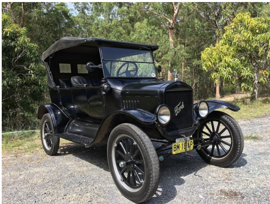
Tento výrobek zahájil 3. průmyslovou revoluci – éru automobilismu. Ford Model T z roku 1925

Příchod automobilu byl zázrak. Nalil se do něho laciný benzín od Rockefellerovy společnosti Standard & Oil a auto dojelo kamkoliv. Auto jste mohli parkovat u chodníku před domem. Mohli jste ho tam nechat stát třeba týden a vyjet s ním jen párkrát za měsíc. Když pršelo, autu na ulici to nevadilo. Když mrzlo, autu to nevadilo.