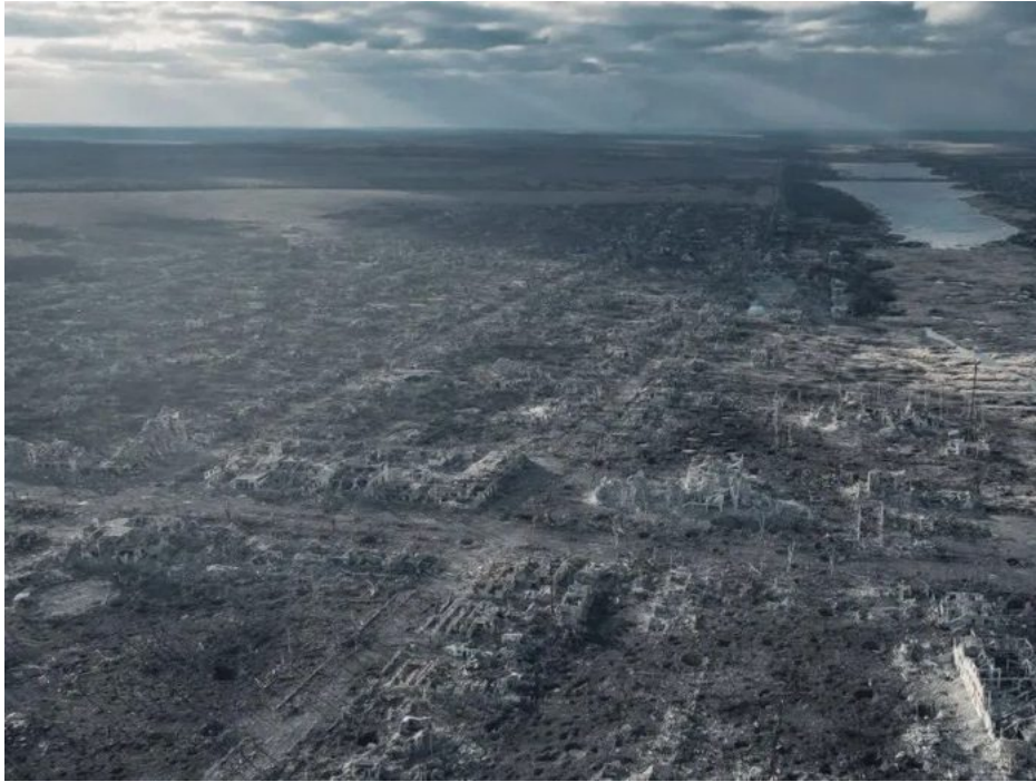
Na s*ačky rozmlácená Marinka, město v Doněcké oblasti po obsazení Rusko armádou po 9 letech bojů povstalců a vojáků od roku 2014

Plánem je rozmlátit Ukrajinu doslova a do písmene na s*ačky ve stejném stylu, jako byla rozmlácena Evropa po II. sv. válce, a potom po válce spustit obrovskou a masivní obnovu Ukrajiny na bázi nového Marshallova plánu, kdy peníze poskytne největší lichvář na světě, tedy Mezinárodní měnový fond (IMF), což není nikdo jiný než dealer nosatého FEDu tisknouceho dolary.