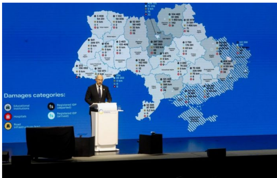
Konference v Luganu, 4 – 5. července 2022

Pamatujete, jak freneticky a i podle pozorovatelů značně předčasně se vloni 4. července konala ve švýcarském Luganu konference o rekonstrukci a obnově Ukrajiny [1], na které si země kolektivního Západu doslova a do písmene rozparcelovaly jednotlivá území Ukrajiny, která budou obnovovat, přičemž na Českou republiku připadla k obnově dnes již ruská Luhanská lidová republika?