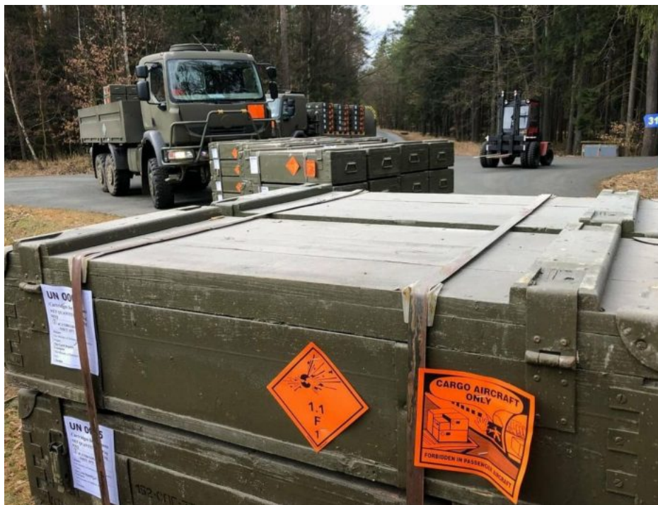
Zbrojní sklady jsou prázdné už i v ČR, dodávky na Ukrajinu proto skončily

Tento nápad Romaněnka je šílený i z pohledu Zelenského vlády, protože odsunutí až milionů Ukrajinců z východní Ukrajiny by se rovnalo de facto etnickému vyčištění, resp. etnickému opuštění celého prostoru , který by potom snadno obsadila Ruská armáda, která by už nemusela brát ohledy na civilisty a mohla by vybombardovat celý východ Ukrajiny do pravěku, podobně jako teď tímto procesem prochází Avdějevka, kterou Rusové již brzy obsadí a stejným procesem prošel Bachmut a nedávno i Marinka. Přesunutí milionů Ukrajinců k hranicím s Polskem by navíc vyděsilo Varšavu, protože žádný ostatný plot by nedokázal zadržet miliony Ukrajinců, pokud by se rozhodli, že už dál nechtějí makat v lágrech a nechtějí bydlet v kontejnerových chatkách.