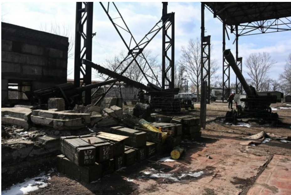
Spotřeba munice ve válce je obrovská a Ukrajině na frontě dochází zásoby střeliva všech typů a ráží

Tohle je de facto katarze chiméry o ukrajinském hrdinství a o vítězství, protože nově už jde o koncentrační tábory pro Ukrajince, kteří mají makat ve válečných šichtovních kousek za hranicí v Polsku. Všechno bude obehnané dráty kolem dokola, takže z Ukrajinců se stanou vězni na nucených pracích. Nedá se očekávat, že by se tento plán dal realizovat, protože podporu nemá ani v Kyjevě.