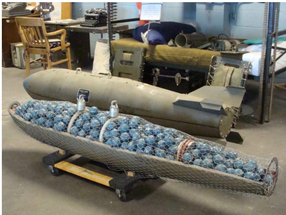
Kazetová munice dodaná z USA pro ukrajinskou armádu na jaře 2023

Protože tím pádem by se Polsko podílelo na přímém válečném úsilí proti Rusku, pokud by hostovalo na svém území provoz ukrajinských zbrojních továren s ukrajinskými zaměstnanci. Vedlo by to k zatažení NATO do války s Ruskem, dříve či později. Někdo by ale musel provoz těch továren hradit, někdo by musel platit výplaty, někdo by musel dodávat suroviny, protože Ukrajinci by dodali jenom lidskou sílu, nic jiného. Vlastně úplně stejně jako na frontě. Tam také Kyjev umí dodat ze své strany jen jednu věc, a to ukrajinské vojáky, protože všechno ostatní je ze západních zemí a z vojenské pomoci z ciziny.