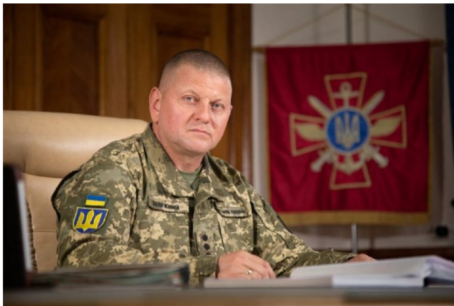
Valerij Zalužný, náčelník generálního štábu AFU

Americký novinář a držitel Pulitzerovy ceny Seymour Hersh totiž ve svém posledním placeném článku odhalil naprostou bombu z amerických zákulisních zdrojů, že probíhají tajná jednání mezi náčelníkem genštábu ukrajinské armády Valerijem Zalužným a jeho ruským protějškem Valerijem Gerasimovem o mírovém urovnání konfliktu, přičemž obě strany se už dohodly, že Rusku by mělo zůstat to území Ukrajiny, které ovládá Ruská armáda, včetně Krymu, a Rusko by výměnou za to už nebránilo Ukrajině ve vstupu do NATO.