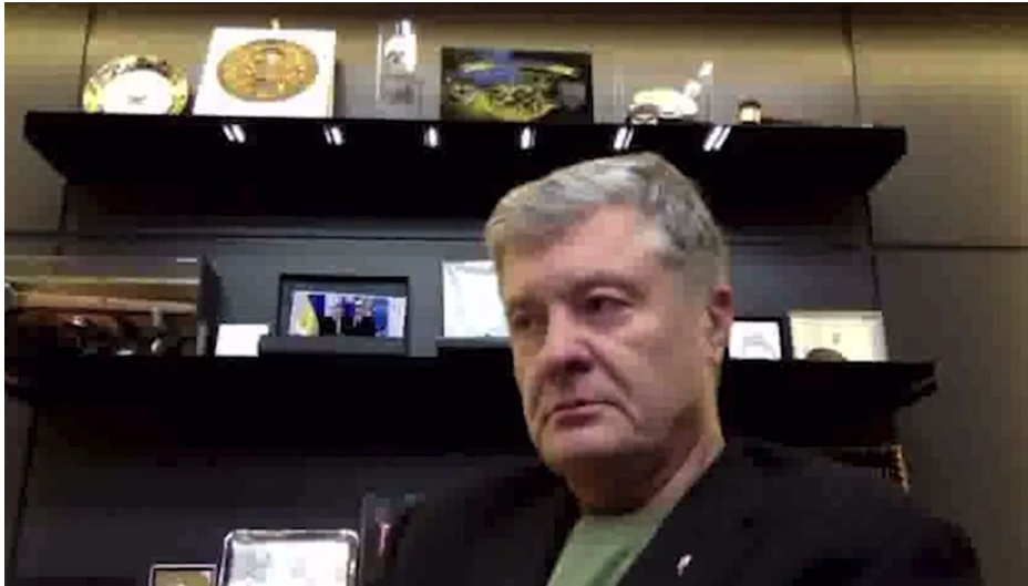
Petro Porošenko, bývalý prezident Ukrajiny

Porošenko je typickým recyklátem, tedy politikem, který sice v minulosti nebyl žádný lumen, ale v porovnání se současným stavem je spatřován jako velmi přijatelná náhrada za Zelenského. Je to de facto stejný recyklační proces jako na Slovensku a stejně jako v Polsku. Na Slovensku došlo k recyklaci Roberta Fica a k jeho transformaci v mezích normy, stejně tak došlo k recyklaci Donalda Tuska v Polsku. Bylo by naivní si myslet, že tento recyklační proces nepostihne i Ukrajinu. Ukrajinský list Novosti.ua [1] k tomu napsal: