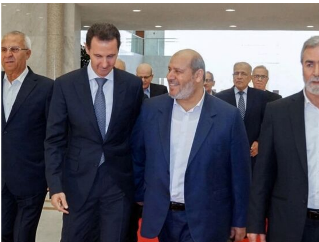
Syrský prezident Bašár Asad přijímá Chalíla Hajju v Damašku 19. října 2022.

prezidenta Bašára Asada. V jeho očích byli všichni „nepřáteli Boha“. Hamás byl financován Izraelem a v Sýrii na jeho bojovníky dohlíželi důstojníci Mosadu a NATO. Po neúspěchu Bratrstva v Egyptě a porážce v Sýrii se však Hamás rozdělil na část věrnou Muslimskému bratrstvu, kterou vedl Cháled Mečál a která stále usilovala o vytvoření globálního chalífátu, a na druhou, která se přeorientovala na osvobození Palestiny. Tento druhý proud, vedený Íránem, obnovil své vazby se Sýrií, dokud jeho vůdce Chalíl Hajja nebyl v Damašku přijat prezidentem Bašárem Asadem. Obnovil také své vazby s libanonským Hizballáhem a dokonce se zúčastnil setkání s ním a dalšími složkami palestinského odporu v Bejrútu.