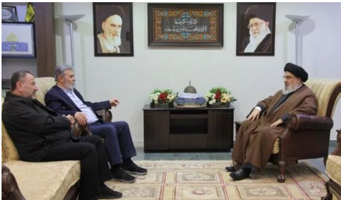
Generální tajemník Hizballáhu Hasan Nasralláh přijal číslo dvě Hamásu Saleha el-Arouiho a vůdce Islámského džihádu Ziada el-Nakhala.

Izraeli. Datum 7. října si vybral pouze Hamás a ostatní palestinské frakce byly informovány jen několik hodin předem. Mimochodem, bojovníci Hamásu byli ve většině ve srovnání s marxisty z PFLP a členy Osy odporu (sdružené kolem Íránu), Islámského džihádu.