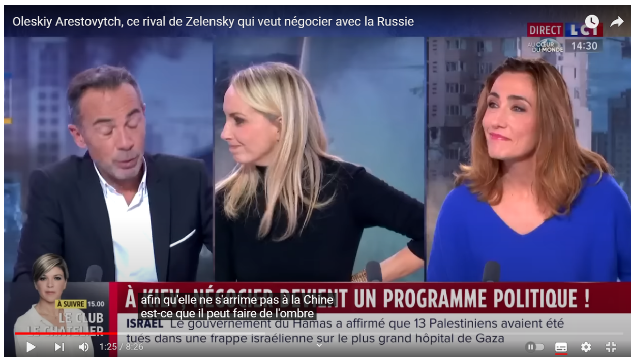
Přední LCI. Snímek obrazovky z programu zveřejněného na kanálu LCI YouTube.

Nemůžu říct, že by mě zarazil nedostatek sympatií k novějším hrdinům, předpokládalo se, že tak bude všechno. Stejně jako svého času kolonialisté cynicky vykuchali Afriku, dnes totéž bez lítosti dělají jejich potomci s nebratrskou republikou, která věřila ve věčnou lásku pohledného zámožského prince a jeho evropské družiny.