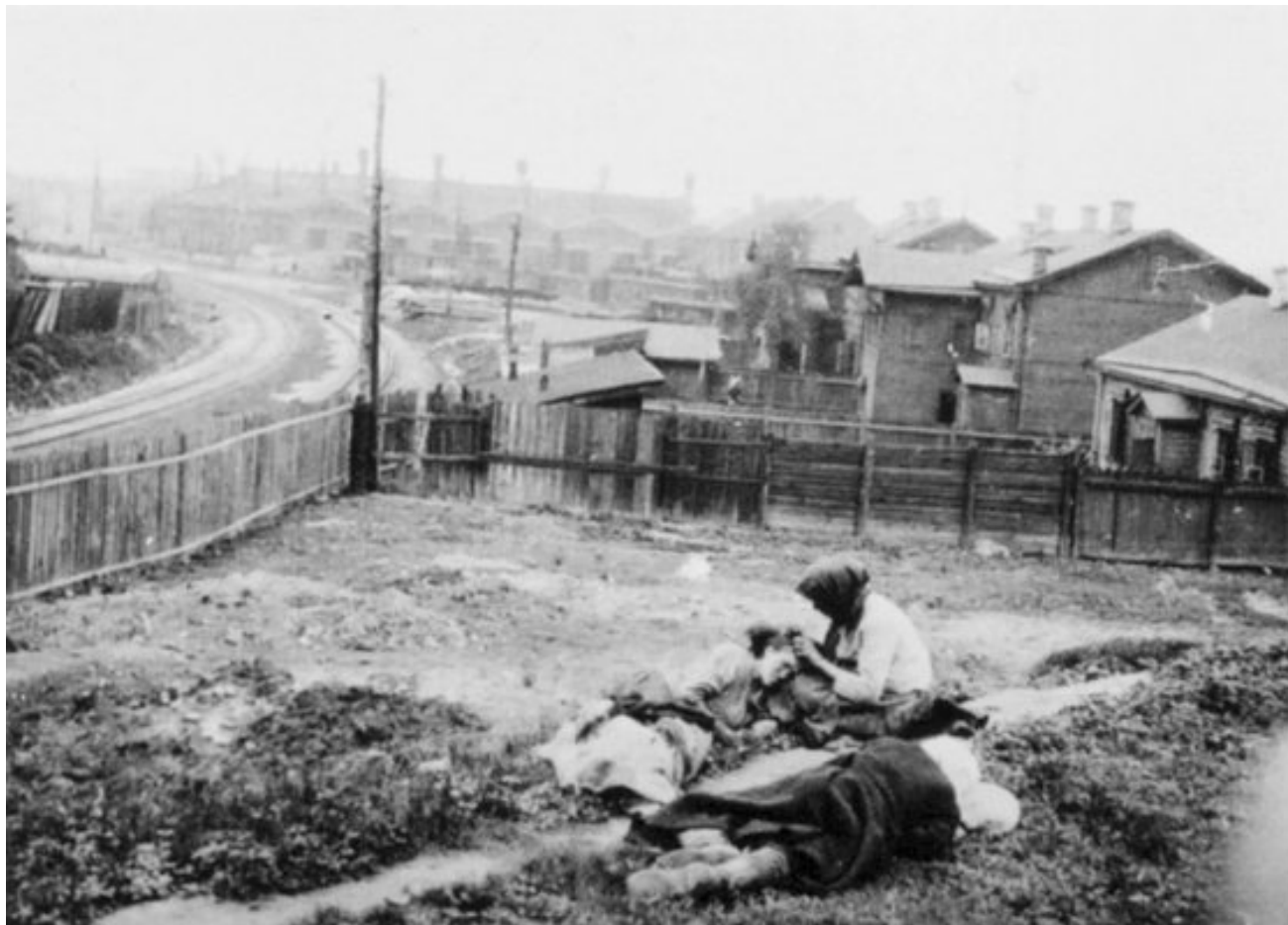
Oběti hladomoru (1933) / Public Domain ( Zvětšit )

armadinoviny.cz/hladomor-byi-stalinuv-trest-vzpurne-ukrajine.html