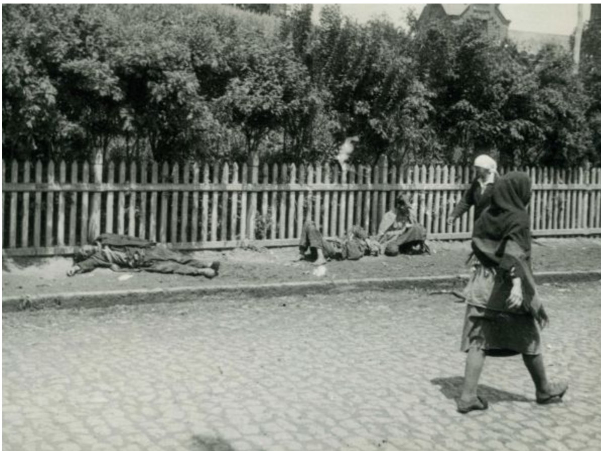
Oběti hladomoru v Charkově (1933); větší foto