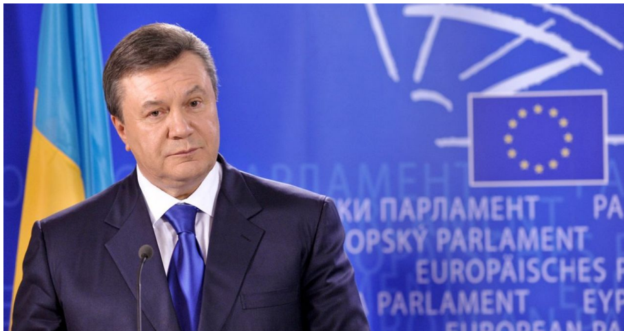
Viktor Janukovyč, poslední legitimní prezident Ukrajiny

V Evropě nemůže existovat bezpečnost a mír, pokud některá země Evropě začne provádět etnické čistky proti ruskému etniku, pokud začne zakazovat ruský jazyk, ruskou literaturu, pokud začne odstraňovat sochy ruských velikanů, sochy osvoboditelů, a pokud naopak začne oslavovat válečné zločince, Stěpana Banderu a jeho nacistický odkaz. Ten proces rusofobie se rozjel po roce 2014 z Ukrajiny do celé Evropy.