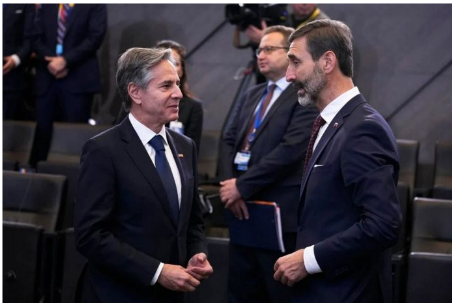
Ministři zahraničí USA a Slovenska, Antony Blinken a Juraj Blanár v Bruselu

Víte, co se může stát? Američané nakoupí pro Ukrajinu zbraně od slovenských zbrojovek, od slovenských obchodníků se zbraněmi, a obratem dostanou od Američanů příkaz, aby ty zaplacené zbraně dodaly na Ukrajinu. Slovensko tak bude dodávat zbraně na Ukrajinu jako předtím, ale slovenská vláda bude alibisticky říkat, že to ne my, to dodávají soukromé zbrojní firmy? To jako fakt? A bylo by tak těžké vládním nařízením zakázat vývoz slovenských zbraní do válečného konfliktu na Ukrajině?