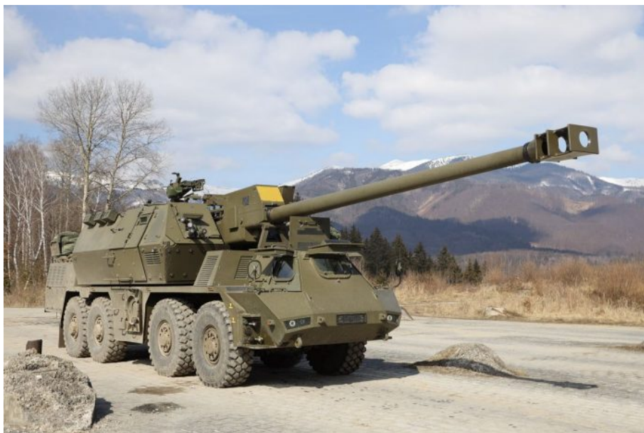
Slovenská samohybná houfnice Zuzana 2

Sorry, Roberte, ale tohle si musíš fakt ujasnit, tady už opravdu balancuješ na tenkém ledě s důvěrou voličů. Buď je prosazování míru na Ukrajině autentický postoj SMER-SD, anebo je to pouze mediální narativ a politická póza před voliči, zatímco zbraně ze Slovenska od soukromých firem budou vesele na Ukrajinu proudit dál, ty slovenské zbraně budou dál zabíjet Slovany na Ukrajině, před čímž Robert Fico sám před 2 týdny varoval [5], zatímco vláda bude mít alibi, že ze skladů slovenské armády už neodešla ani patrona. A k čemu to povede?