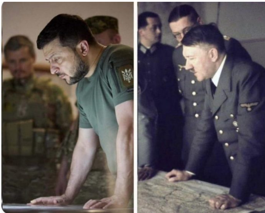
Podobnost ne čistě náhodná

Vybít všechny Ukrajince na frontě a potom je nahradit jinými muži, kteří převezmou Ukrajinu, převezmou pozemky, statky, farmy, podniky, závody, byty, baráky, prostě všechno, společně s ženami. Myslíte, že přeháním? Ani omylem. Takhle totiž pracovali Conquistadoři v Latinské Americe na počátku novověku.